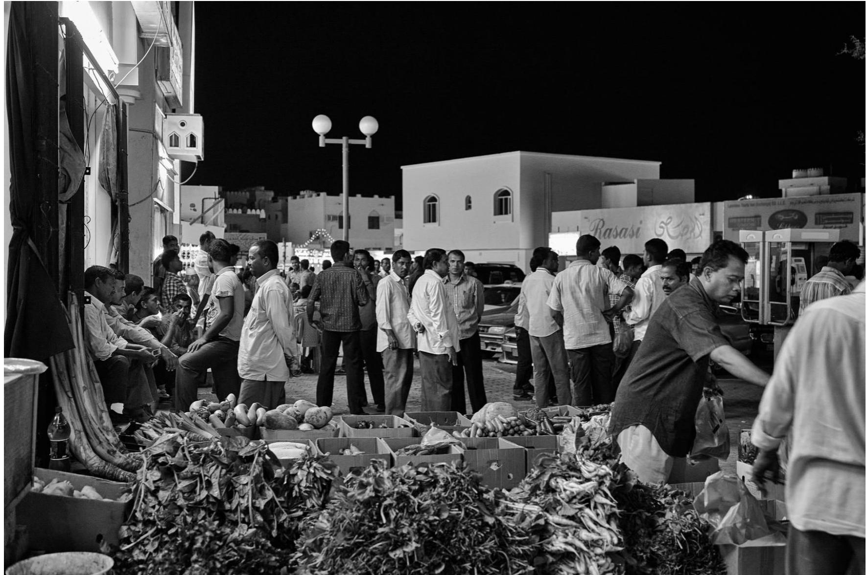
Sur Oman, 2011