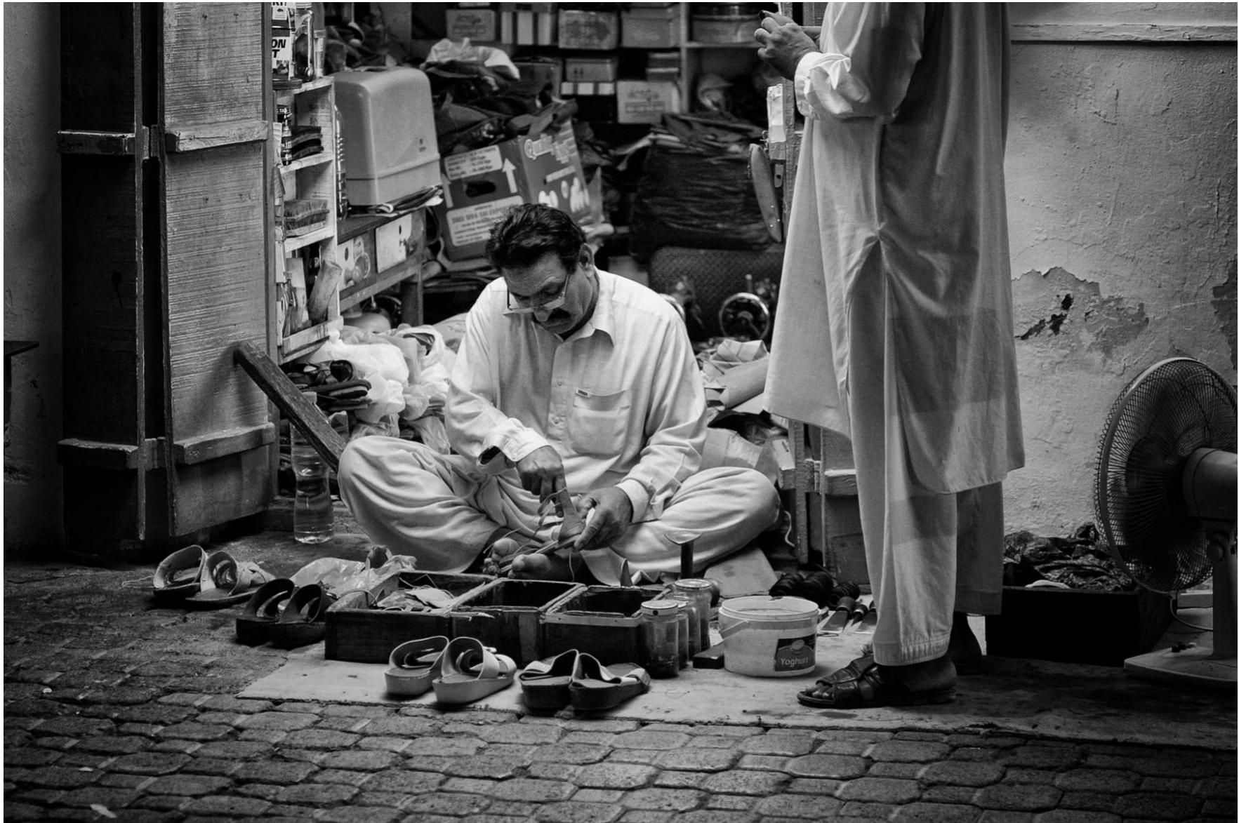
Sur Oman, 2011