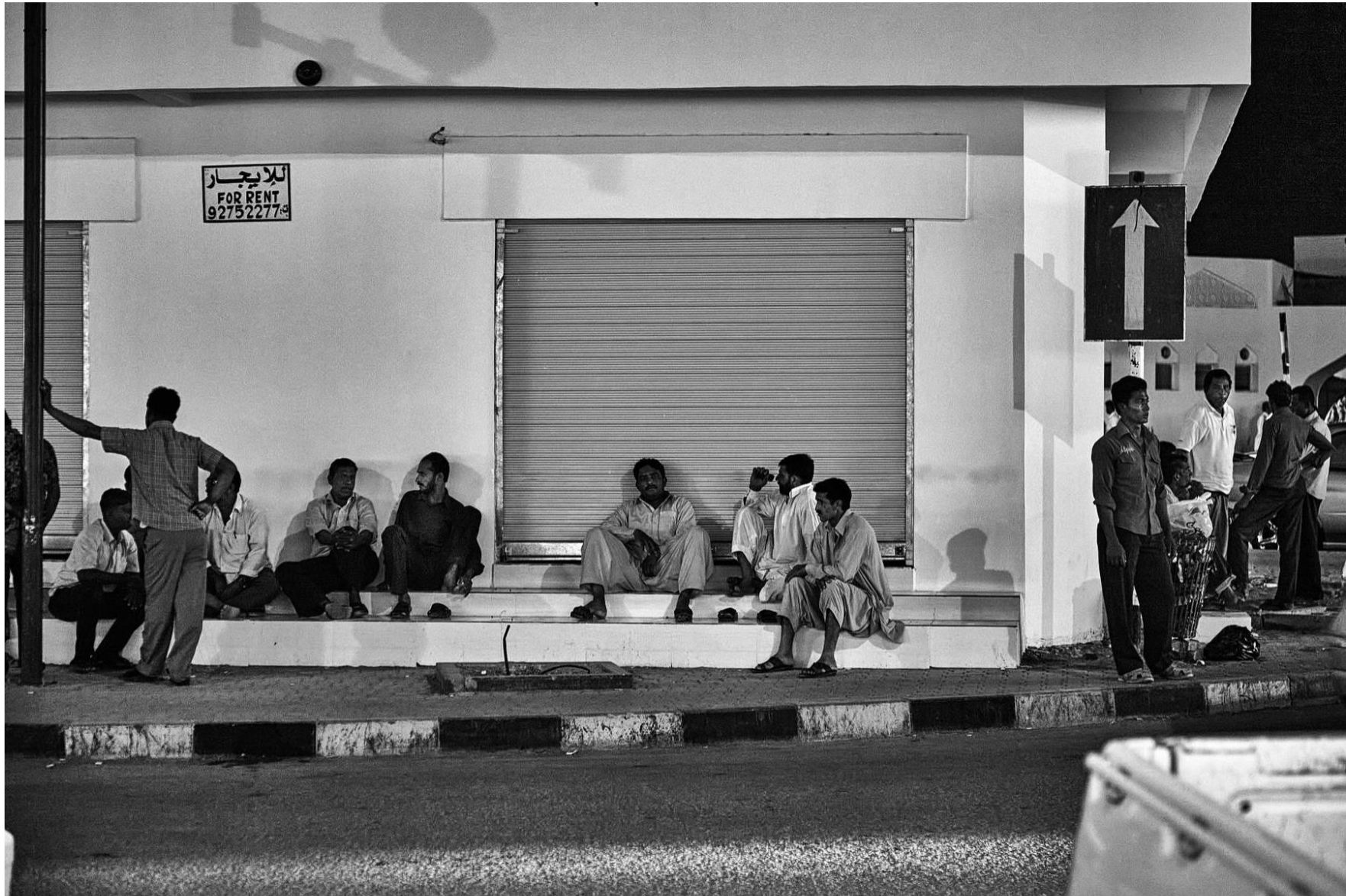
Sur Oman, 2011