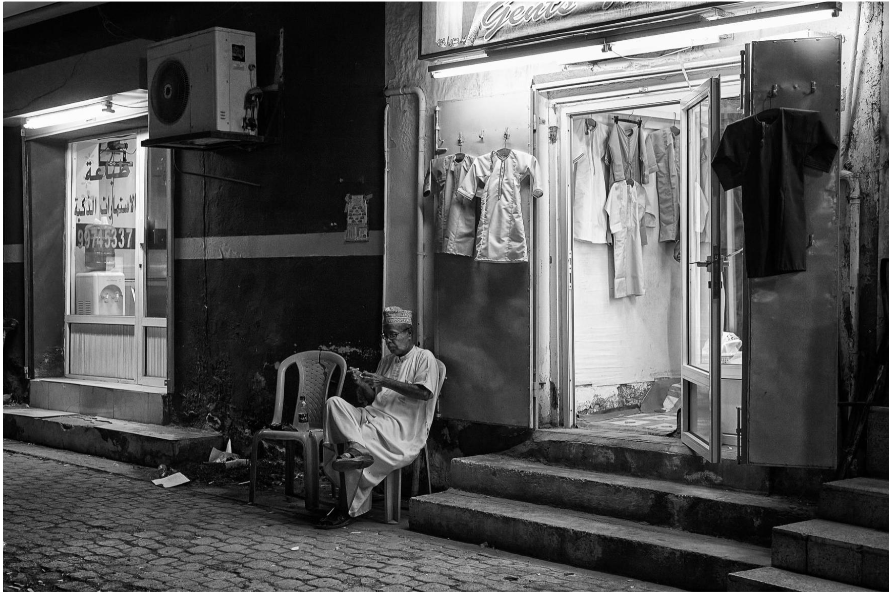
Sur Oman, 2011