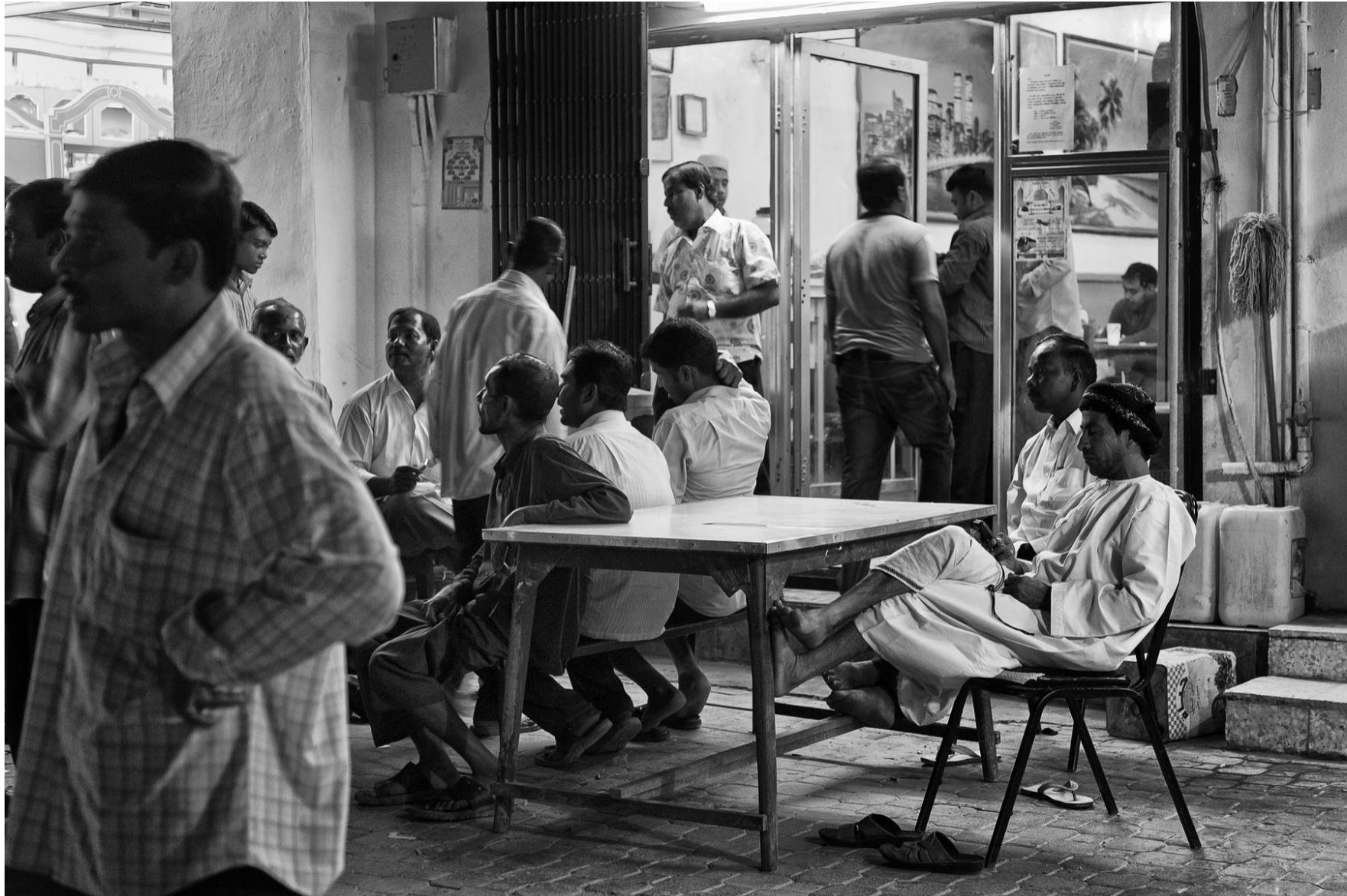
Sur Oman, 2011