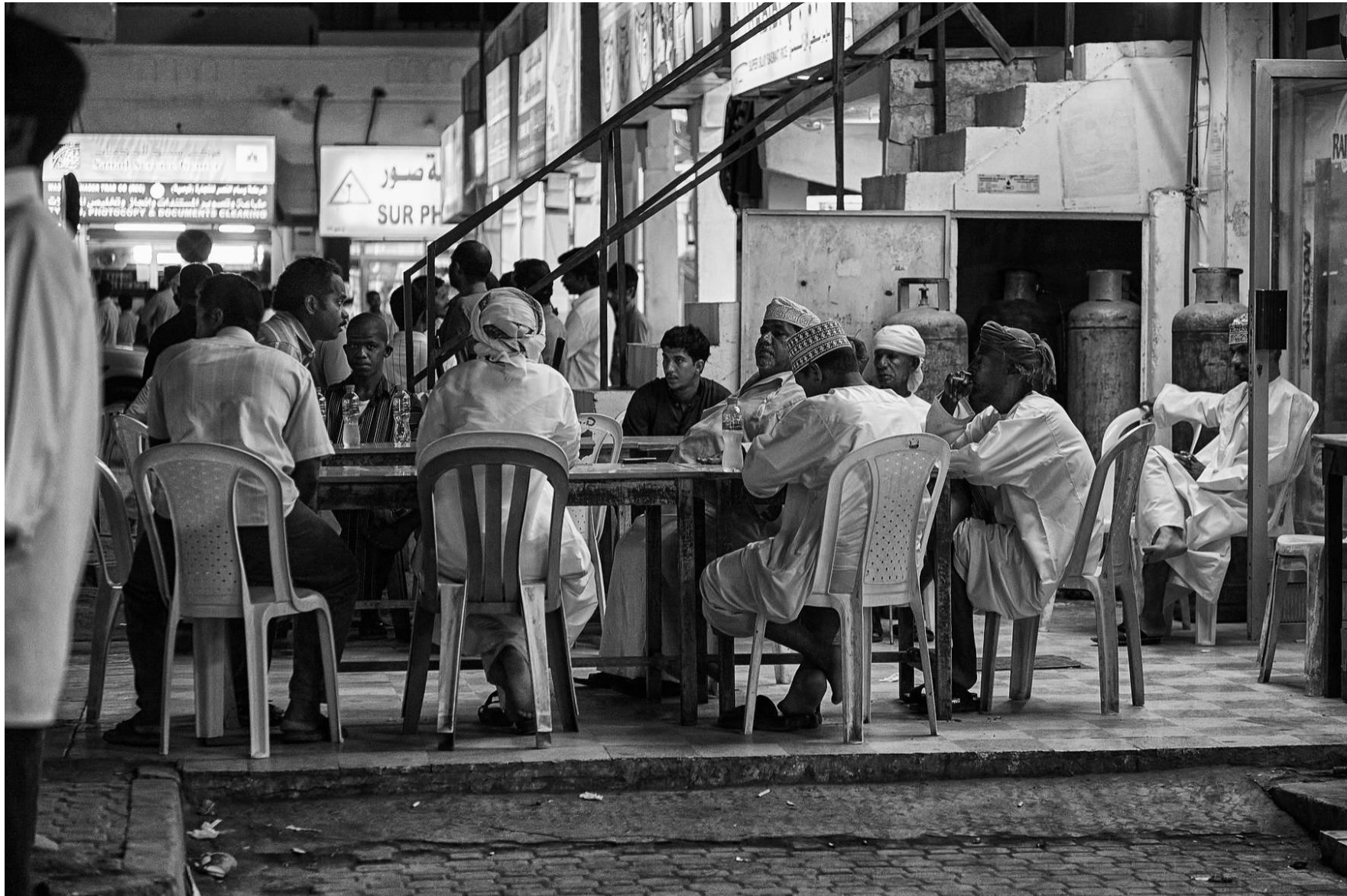
Sur Oman, 2011