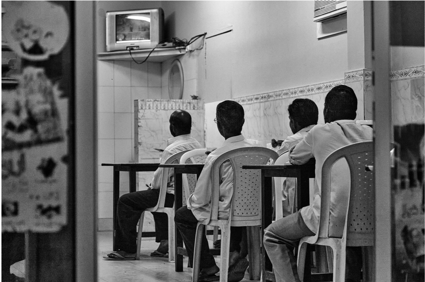
Sur Oman, 2011