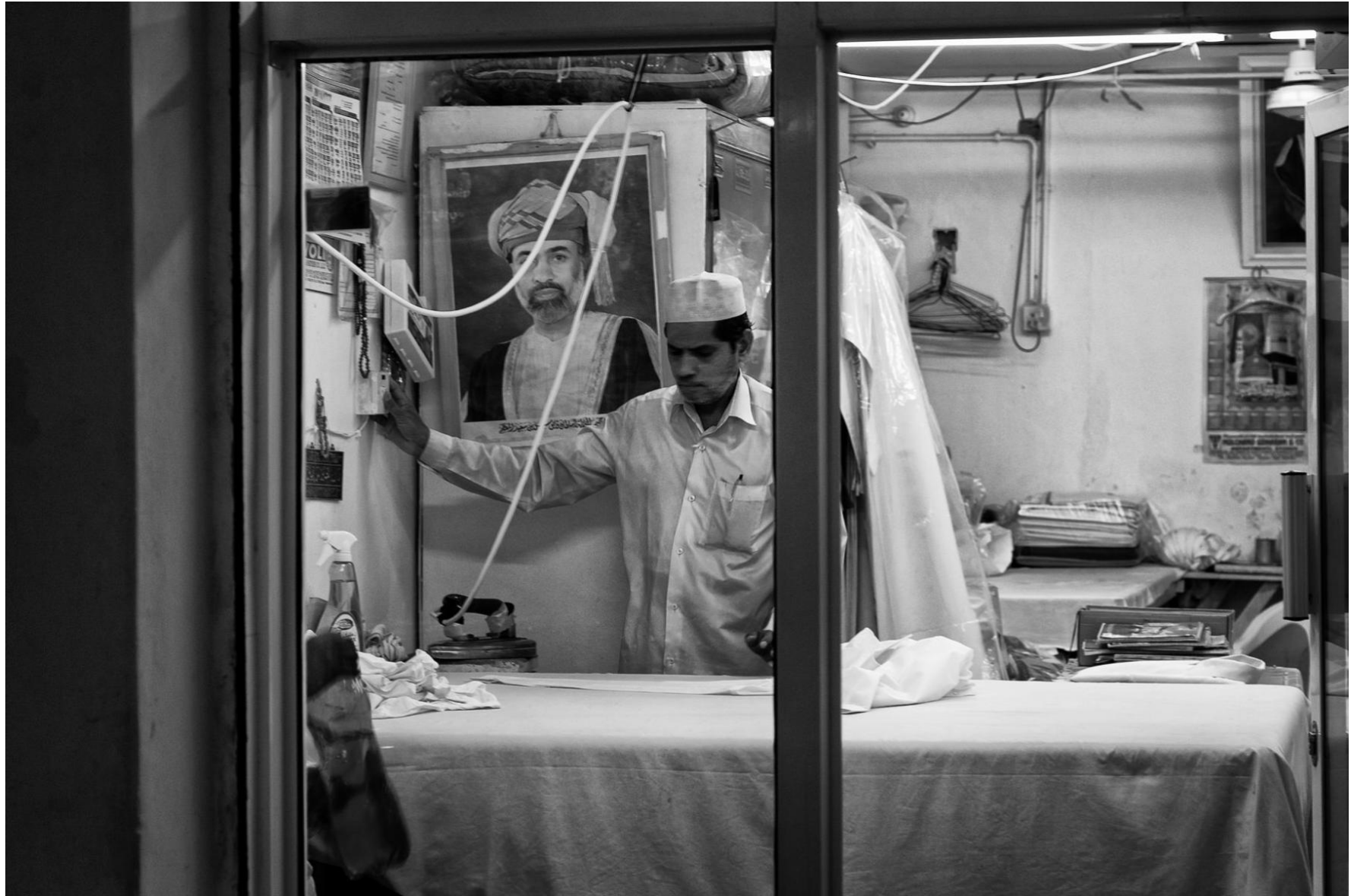
Sur Oman, 2011