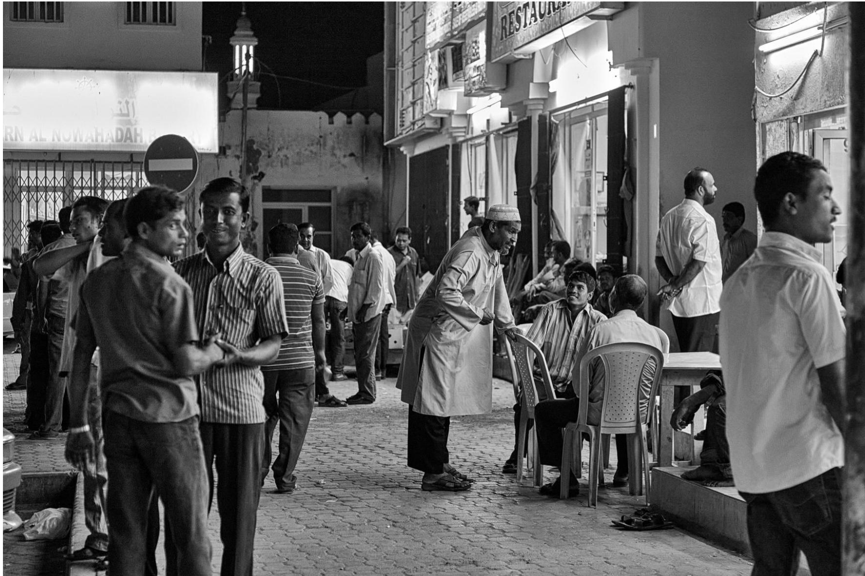
Sur Oman, 2011