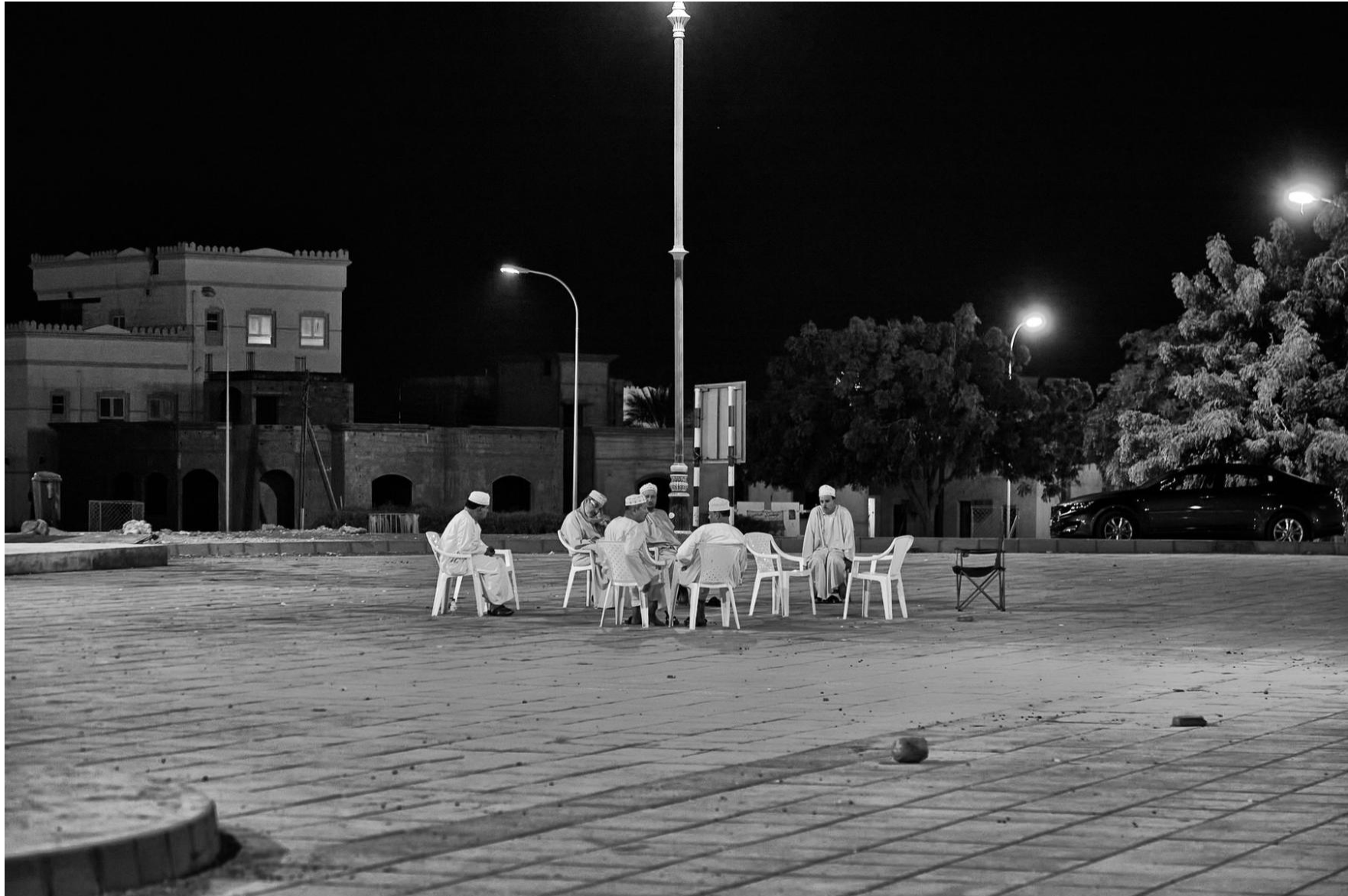
Sur Oman, 2011