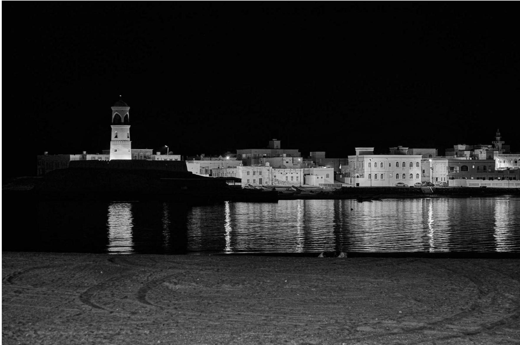
Sur Oman, 2011