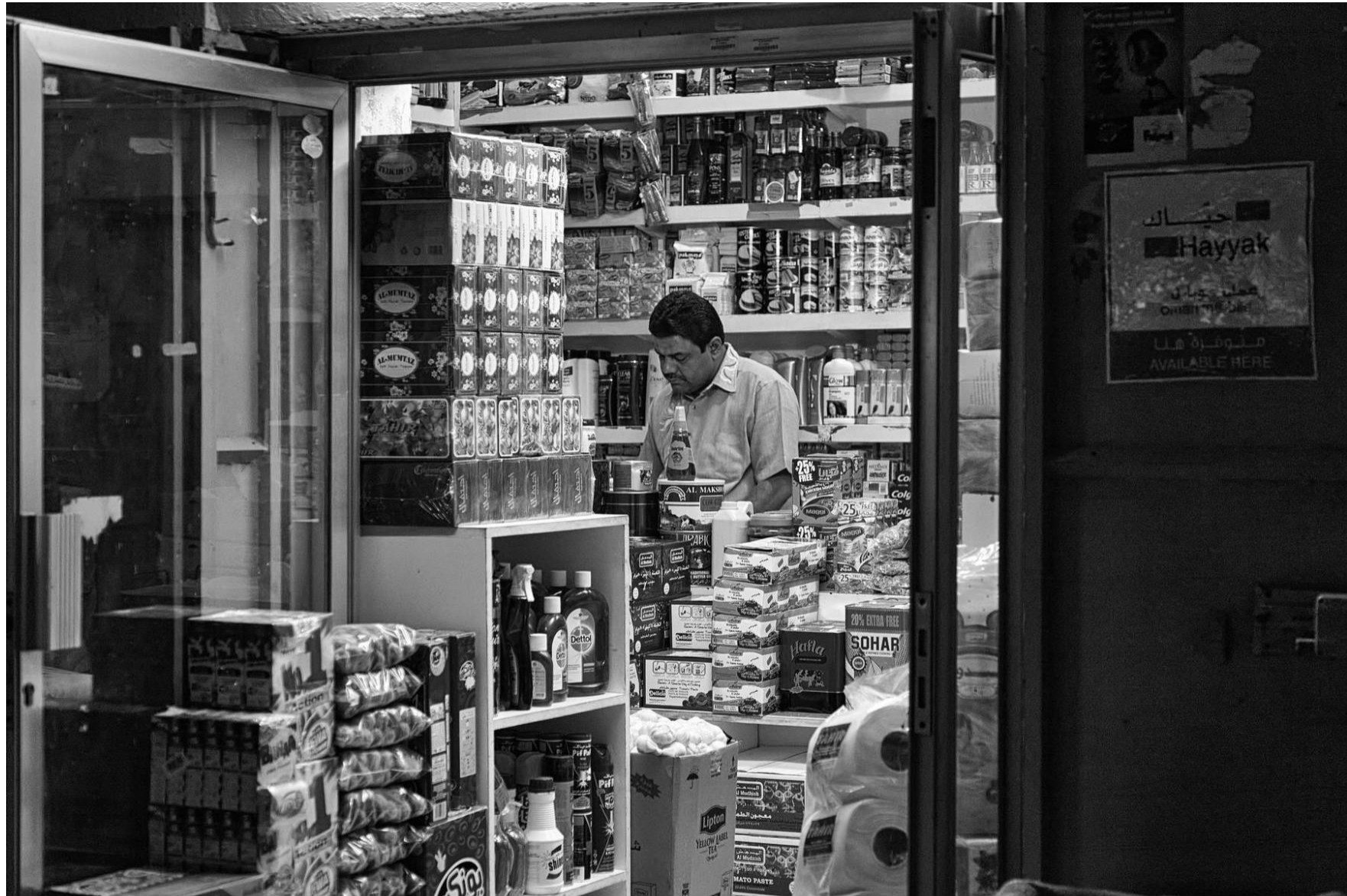
Sur Oman, 2011