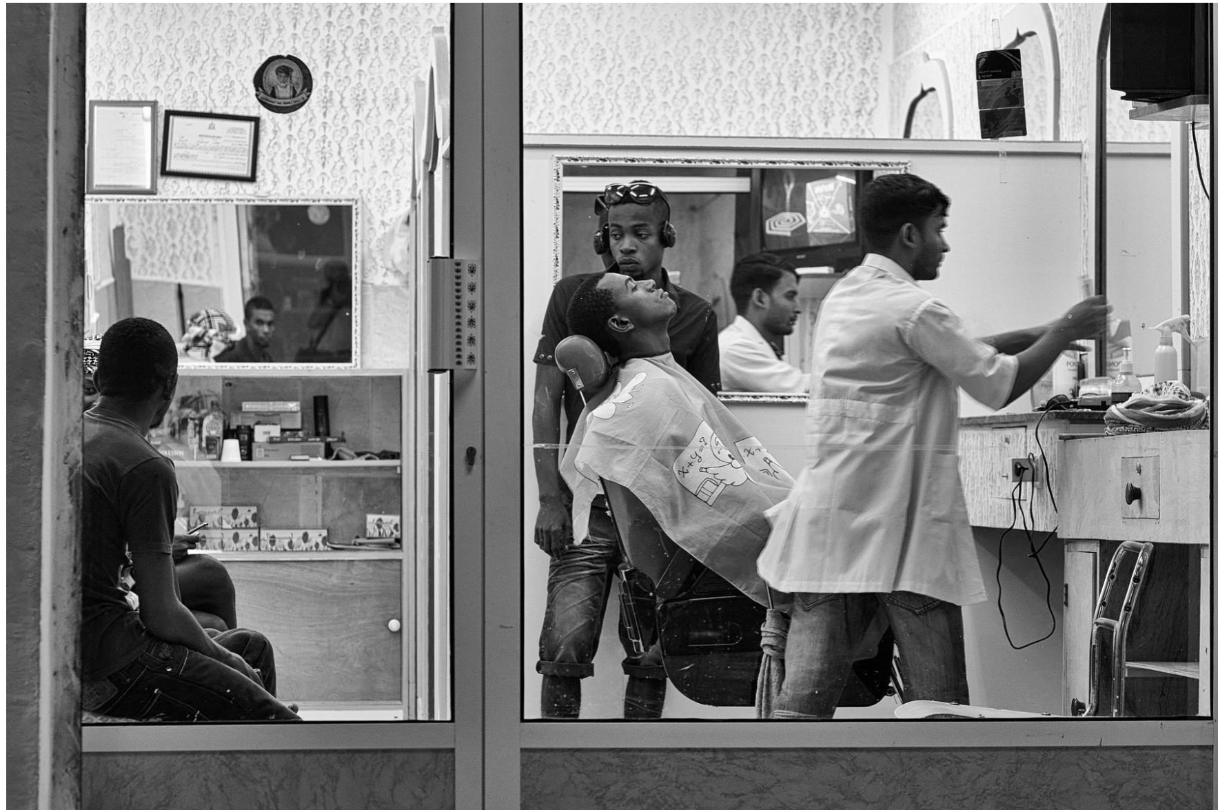
Sur Oman, 2011