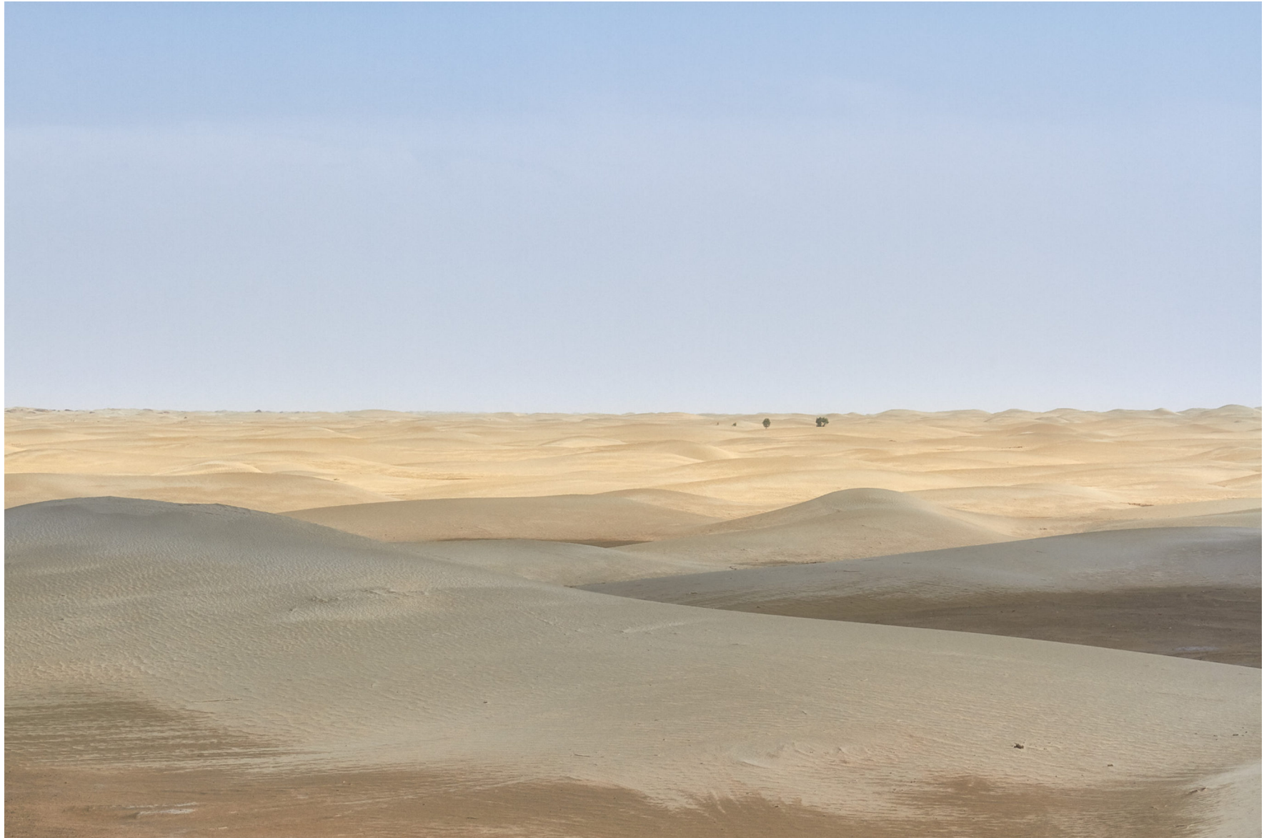
Taklamakan-Wüste, China, Juni 2014