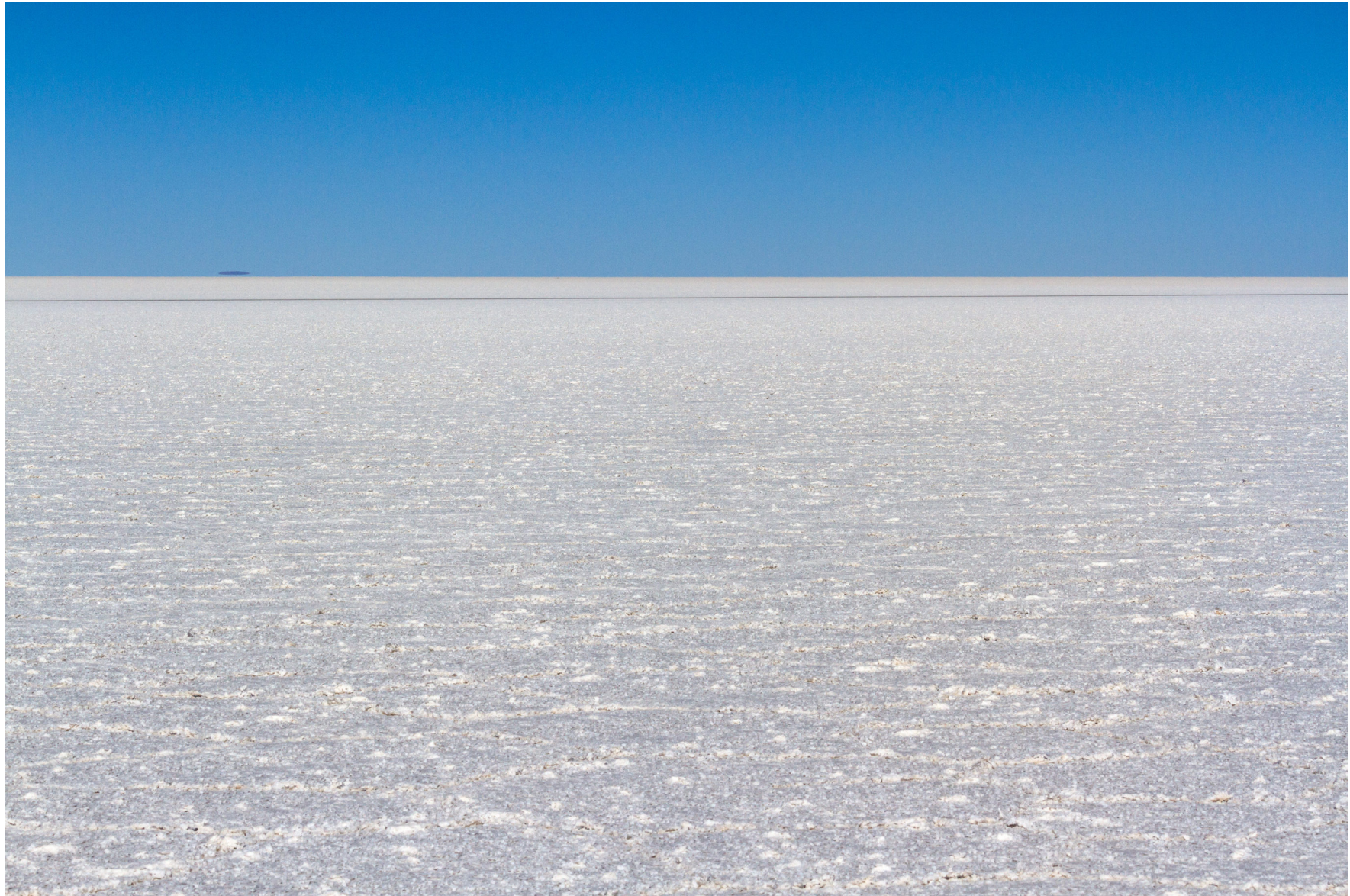
Salar de Uyuni, Bolivien, August 2016