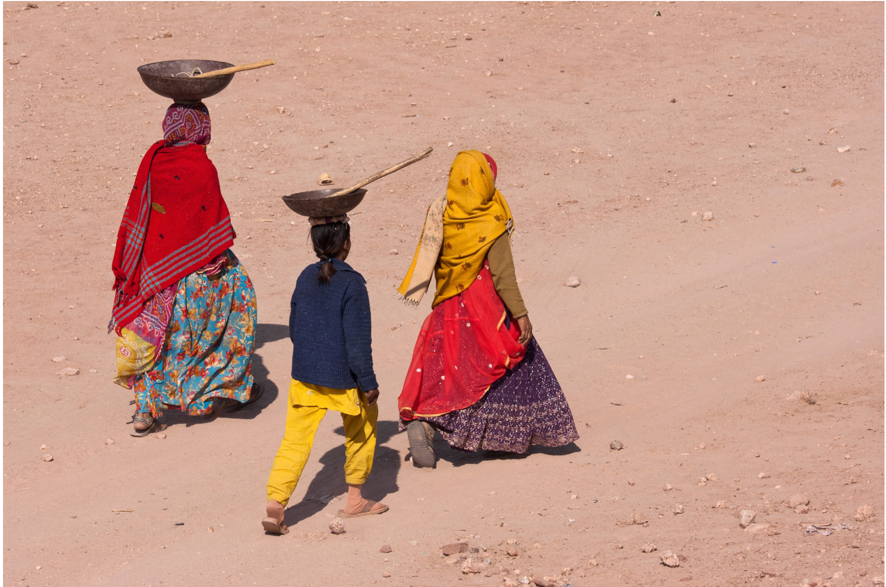
Wüste Thar, Indien, August 2011