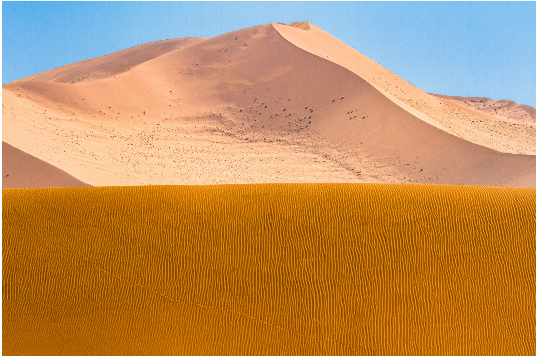
Namib, Namibia 2013