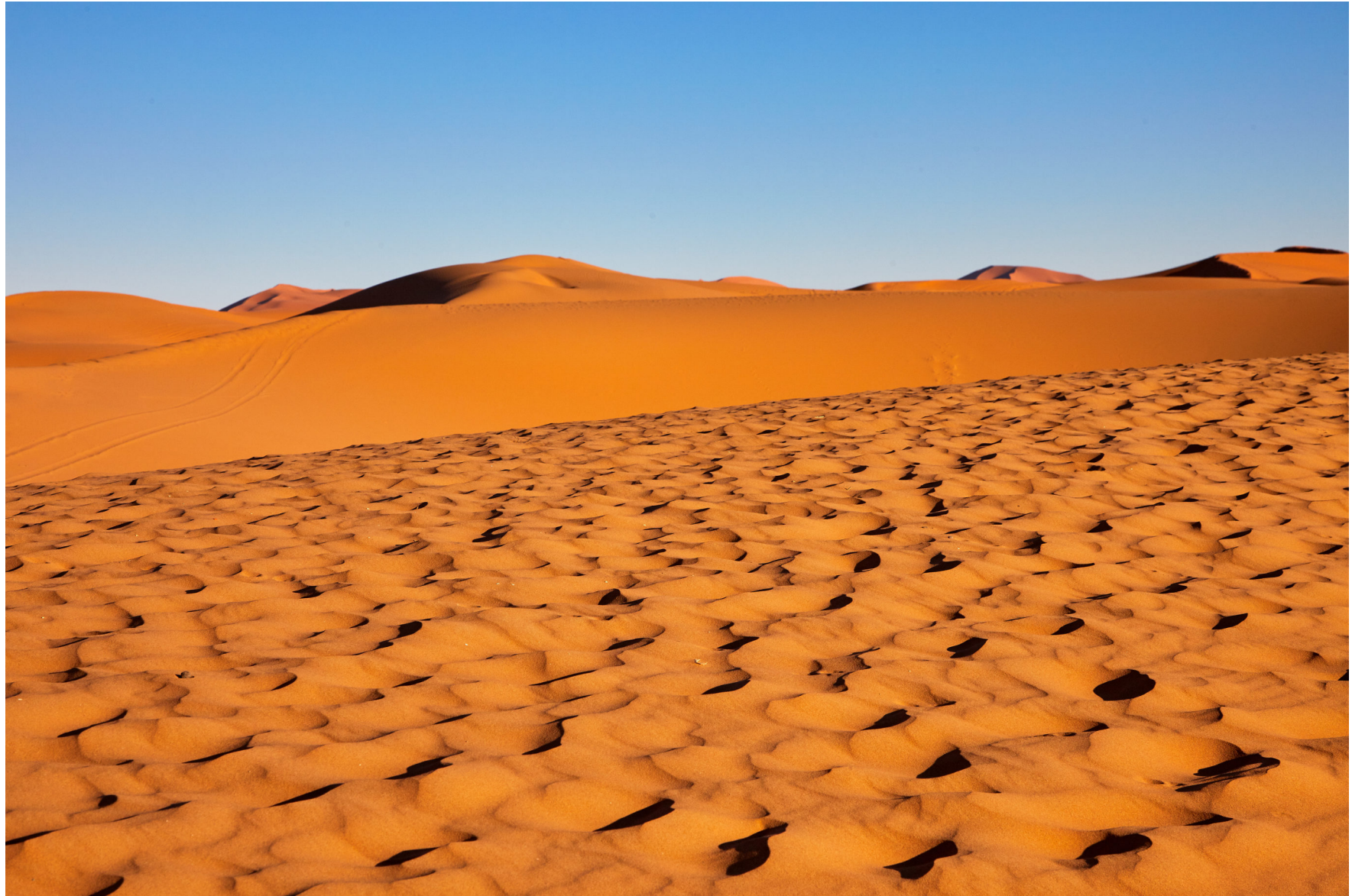
Ausläufer der Sahara, Erg Chebi, Marokko 2012