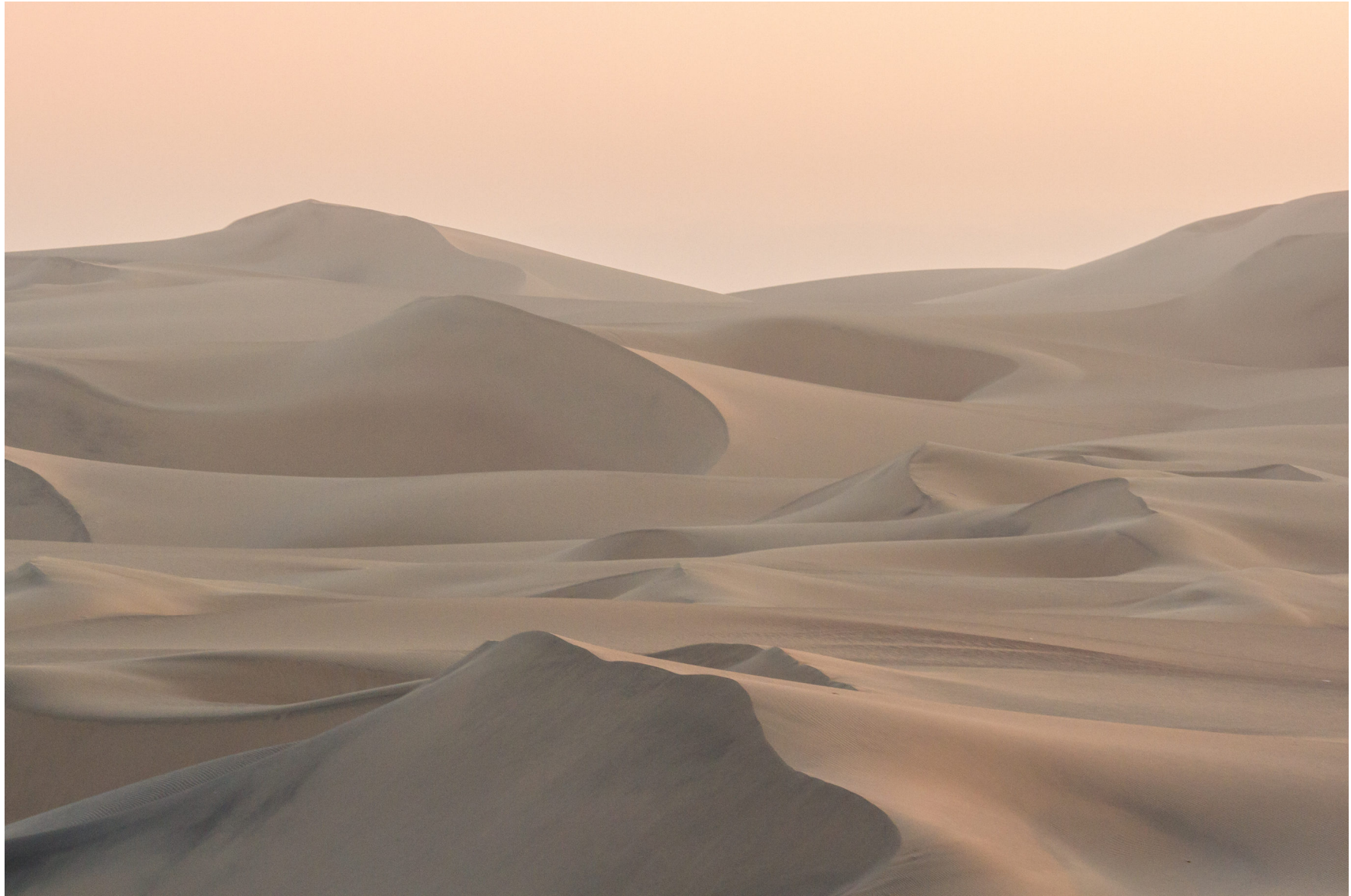
Peruanische Küstenwüste, Peru, August 2016