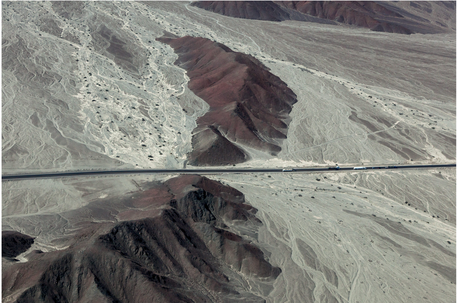
Peruanische Küstenwüste, Peru, August 2016