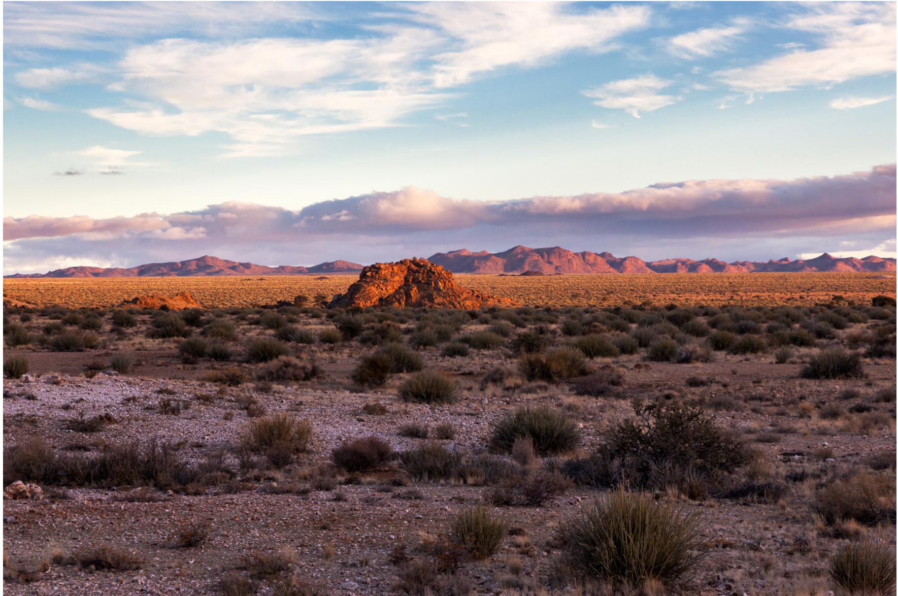
Kalahari, Namibia 2013