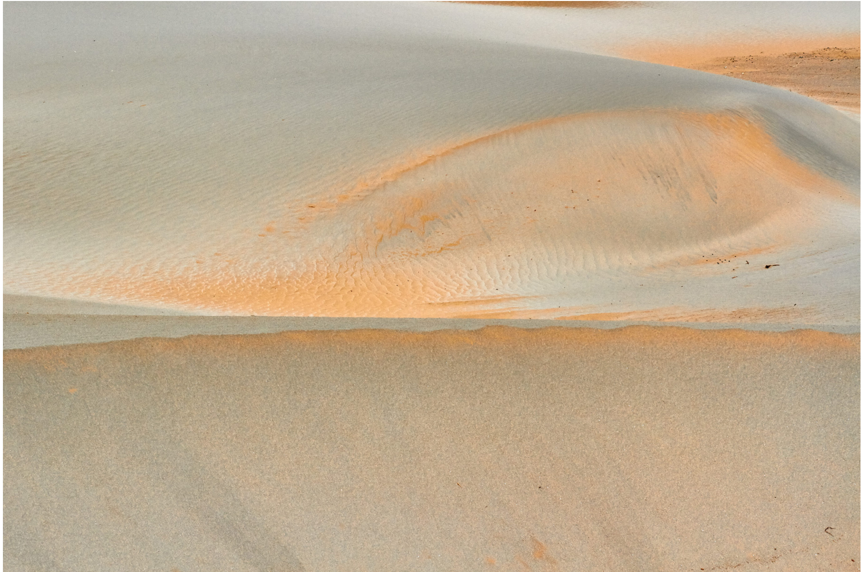
Taklamakan-Wüste, China, Juni 2014