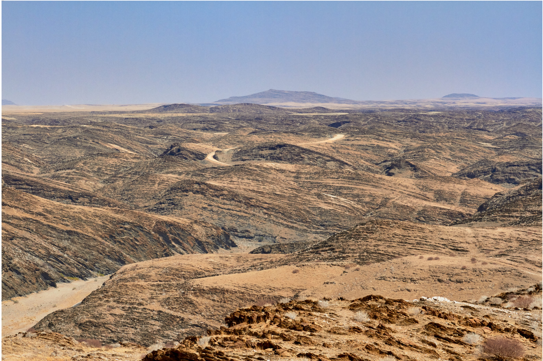
Namib, Namibia 2013