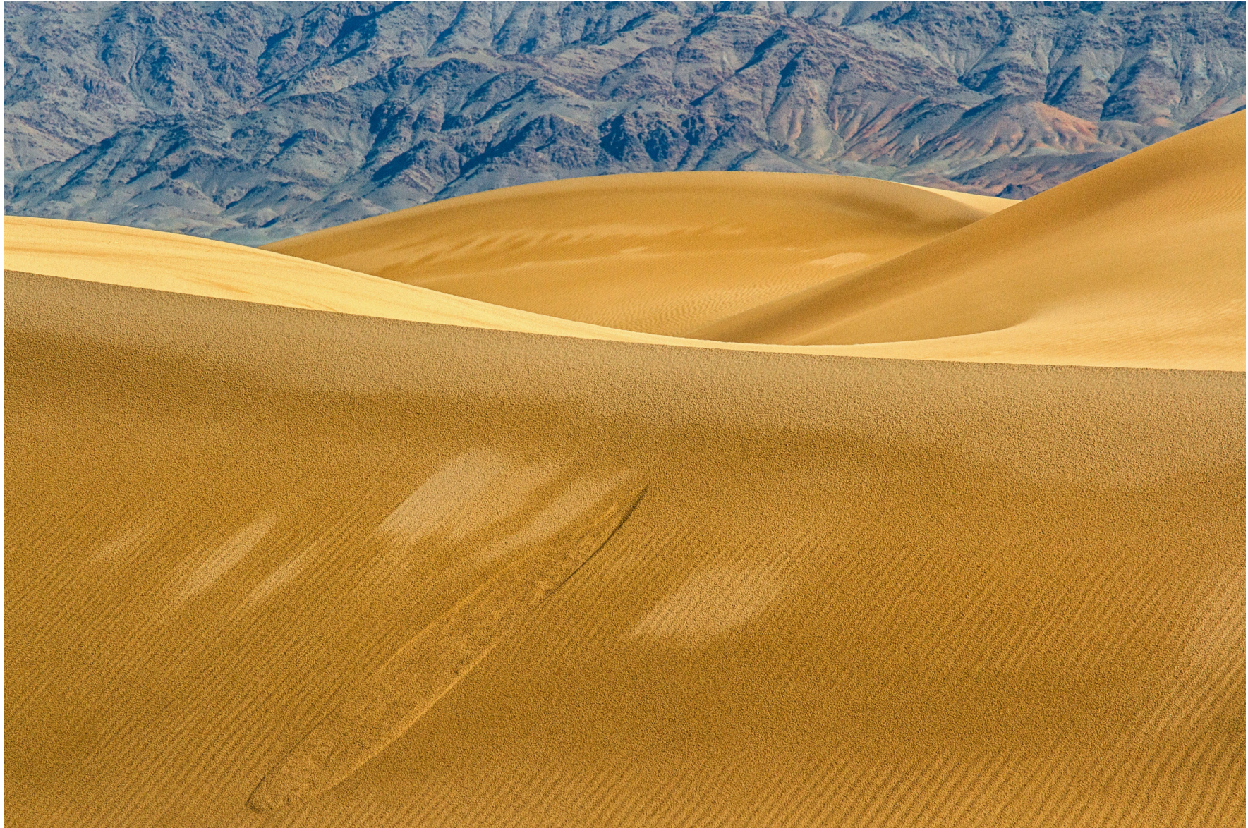
Wüste Gobi, Mongolei 2017