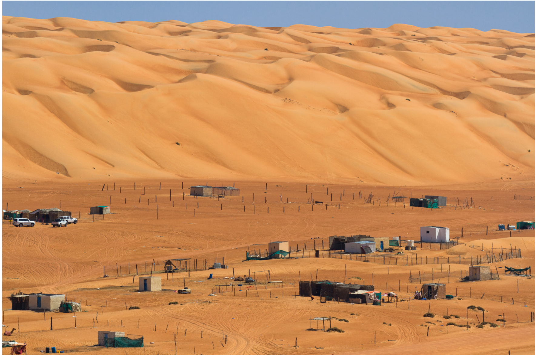
Wahiba Wüste, Oman 2011