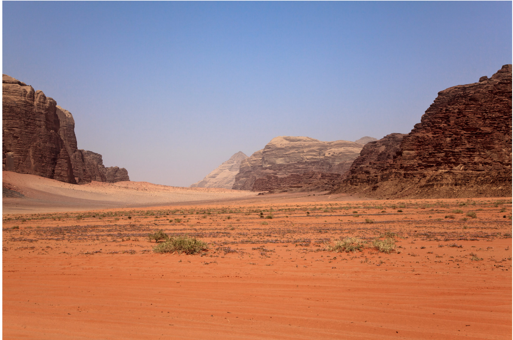
Wadi Rum, Jordanien 2010