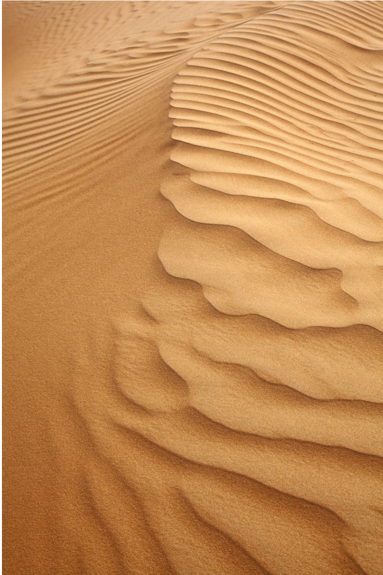
Wahiba Wüste, Oman 2011