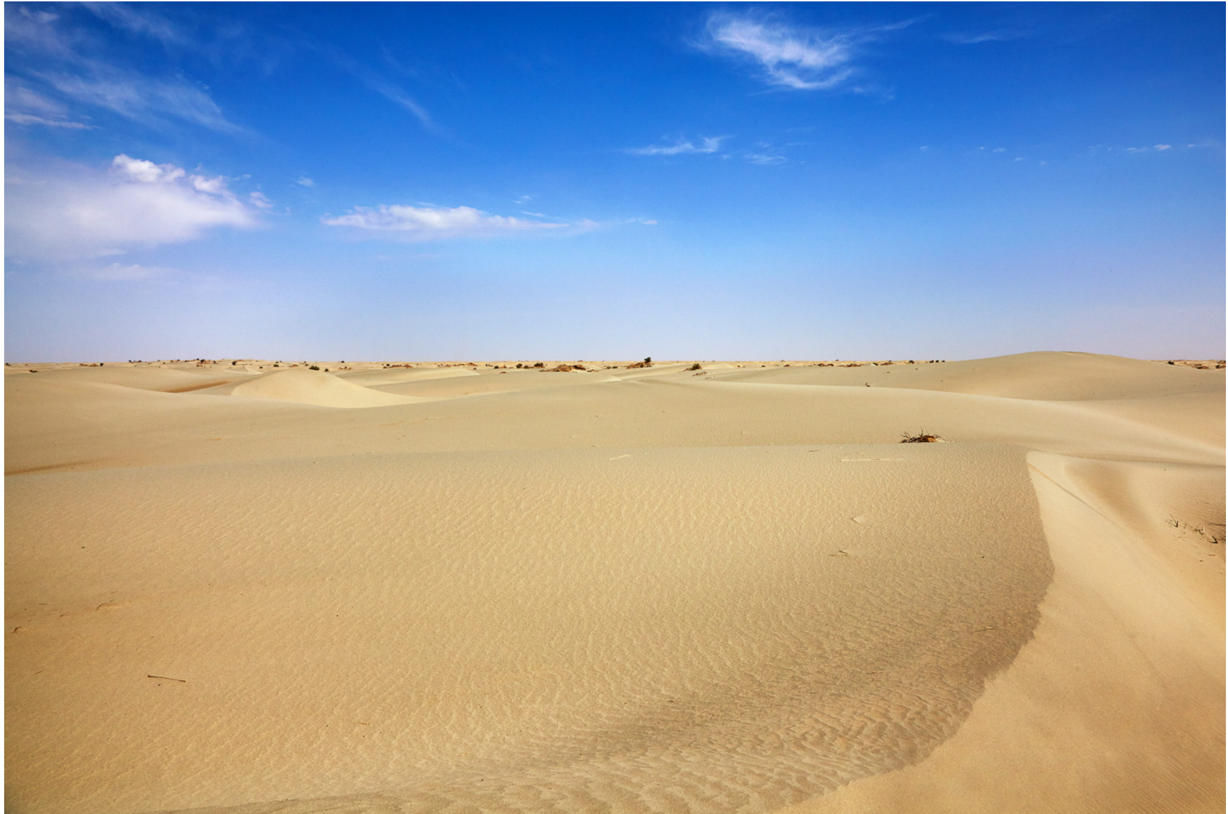
Taklamakan-Wüste, China, Juni 2014