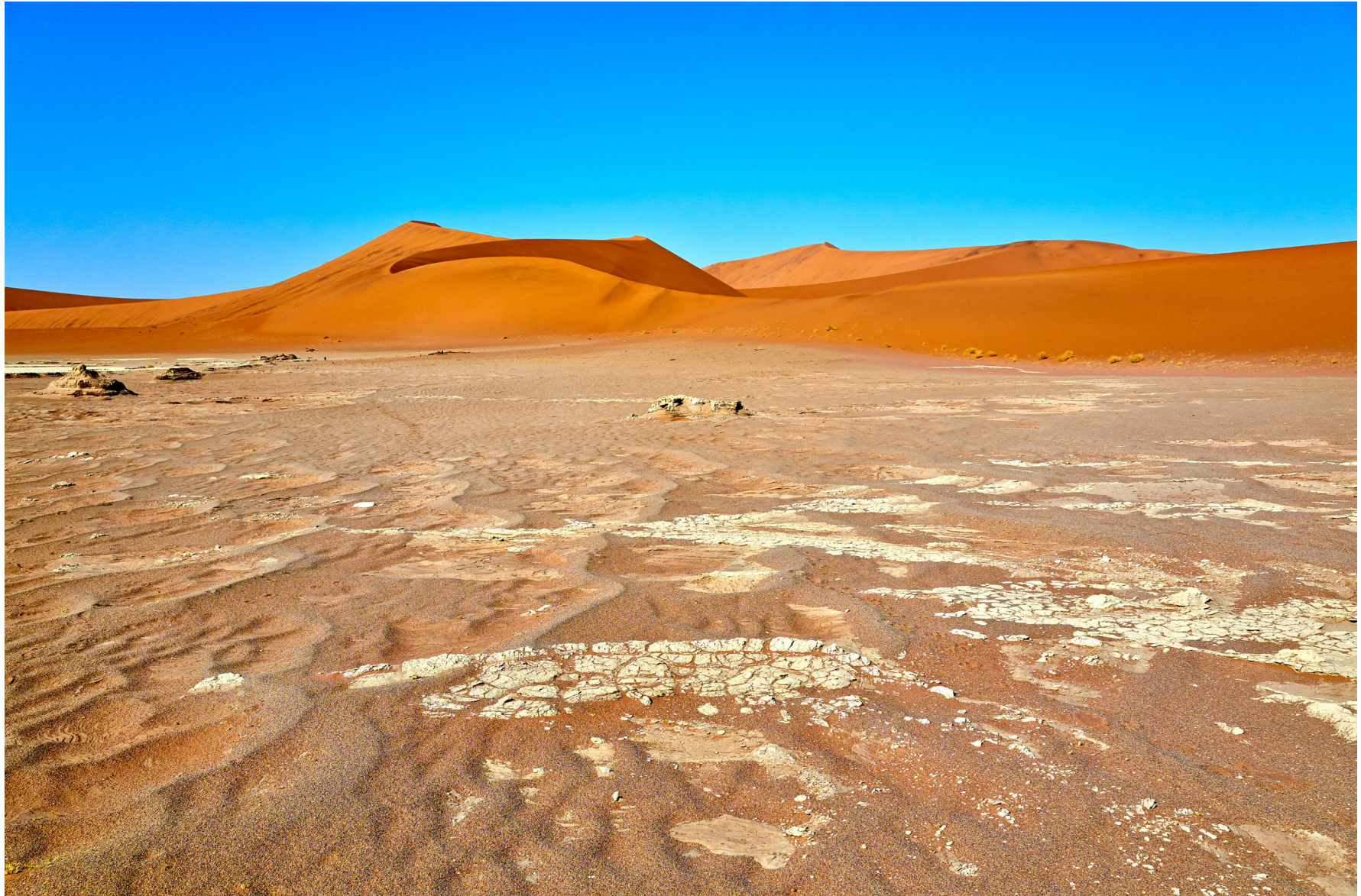
Namib, Namibia 2013