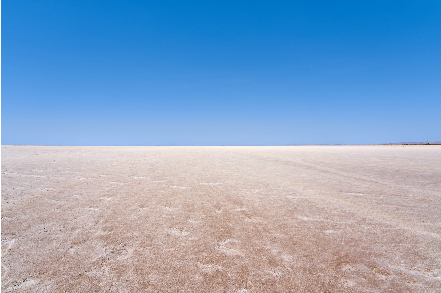
Chott el Djerid Tunesien 2019