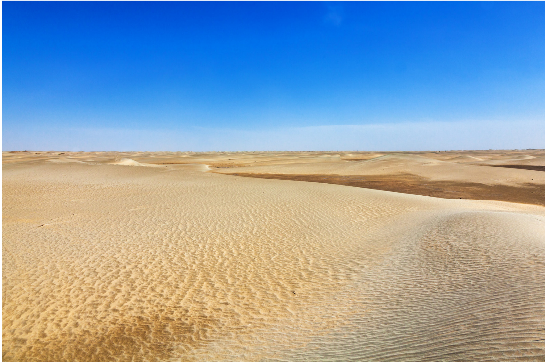
Taklamakan-Wüste, China, Juni 2014