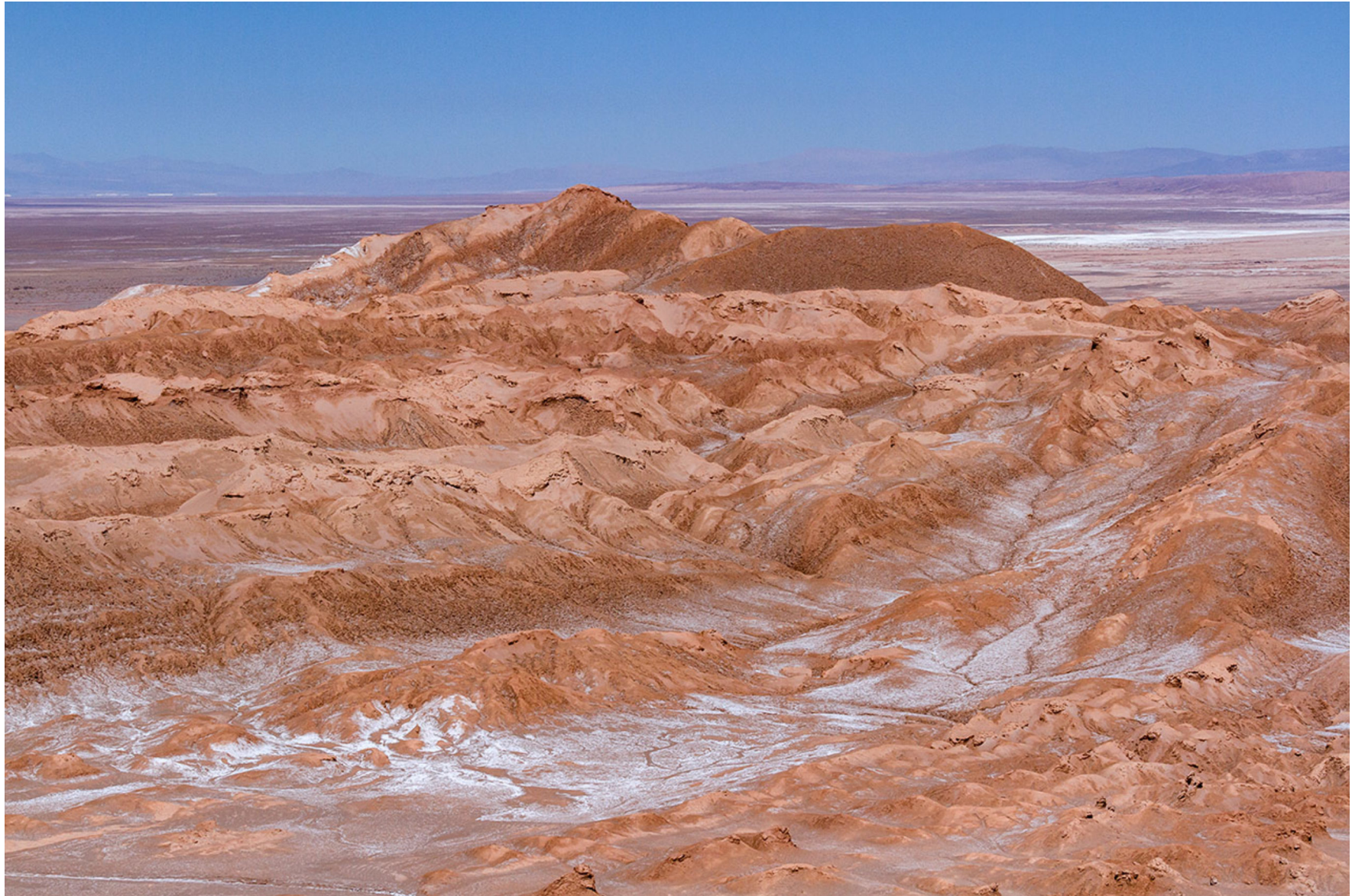
Atacama, Chile, August 2016