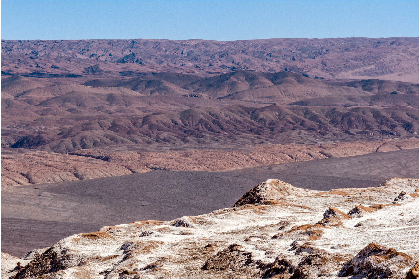
Atacama, Chile, August 2016