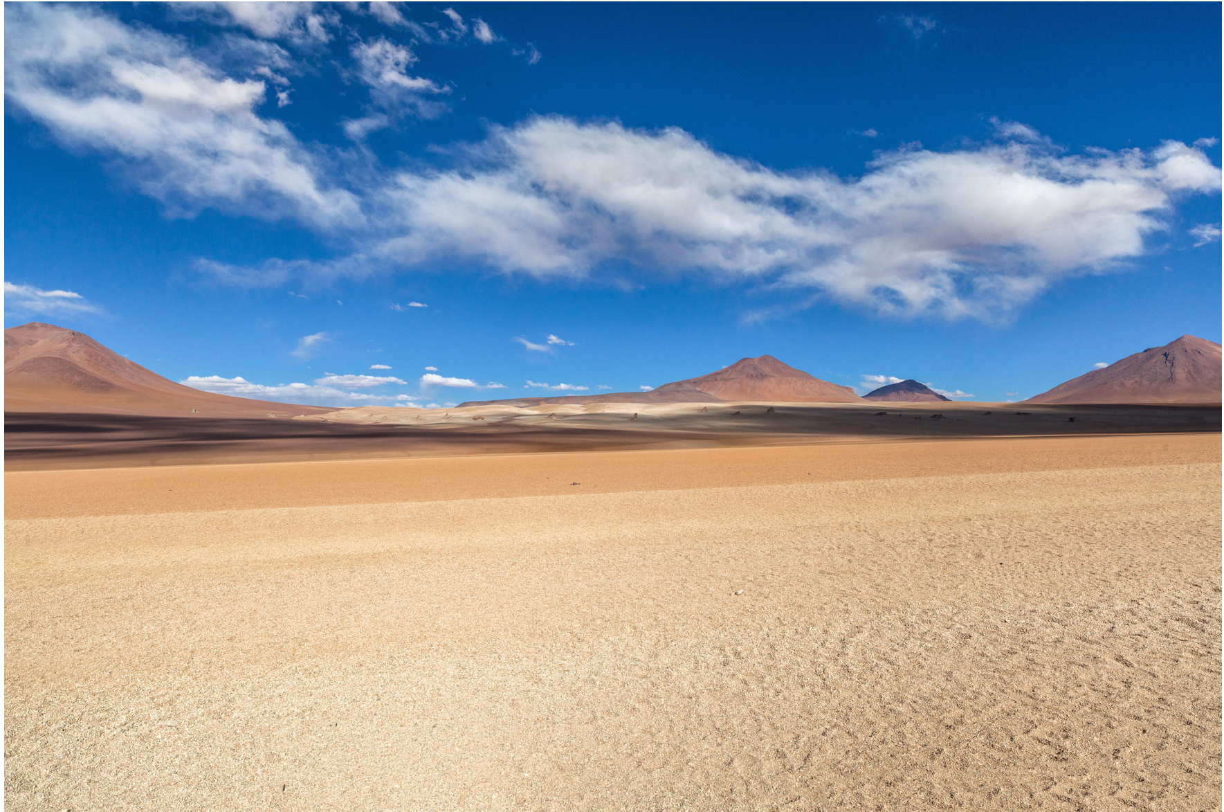
Siloli Wüste, Bolivien August 2016