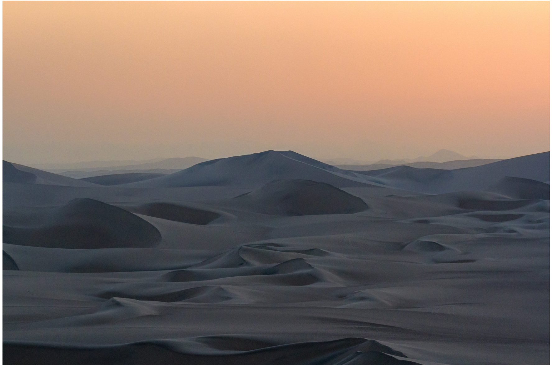
Peruanische Küstenwüste, Peru, August 2016