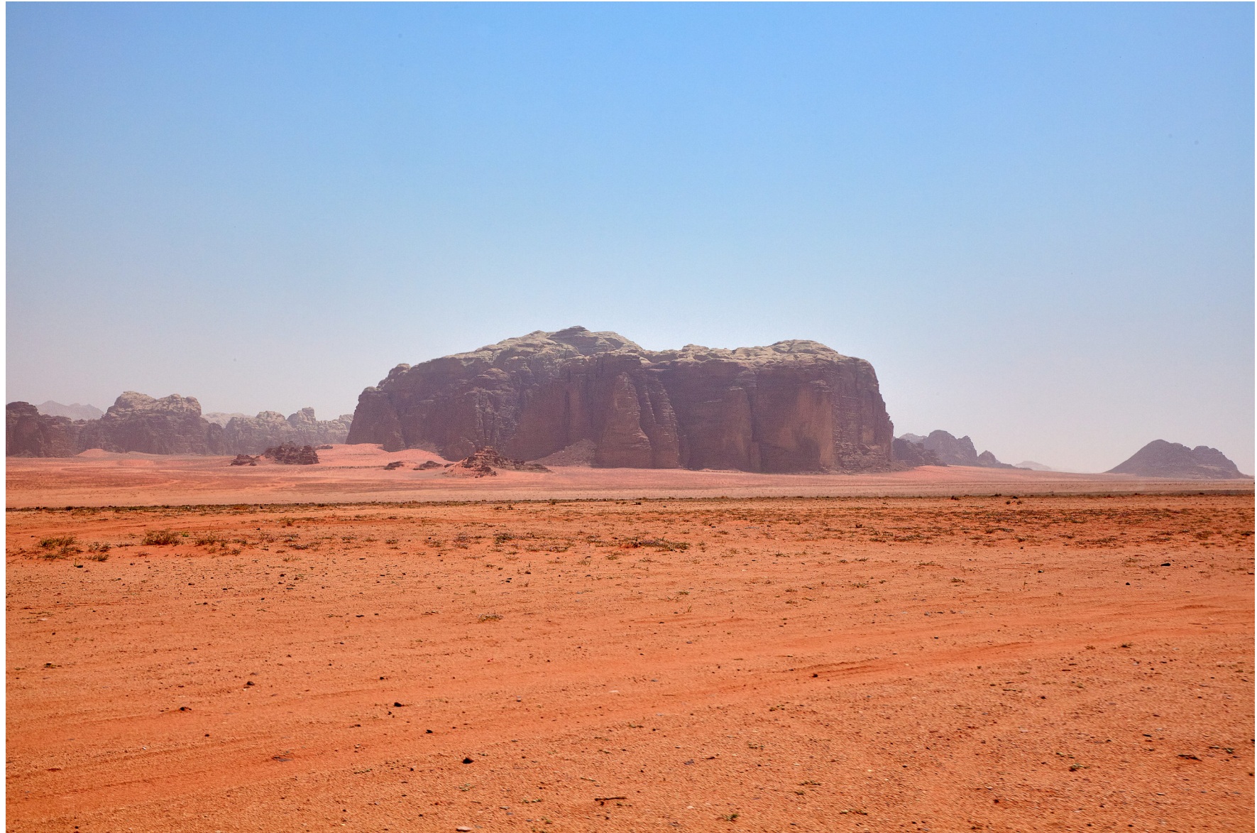
Wadi Rum, Jordanien 2010