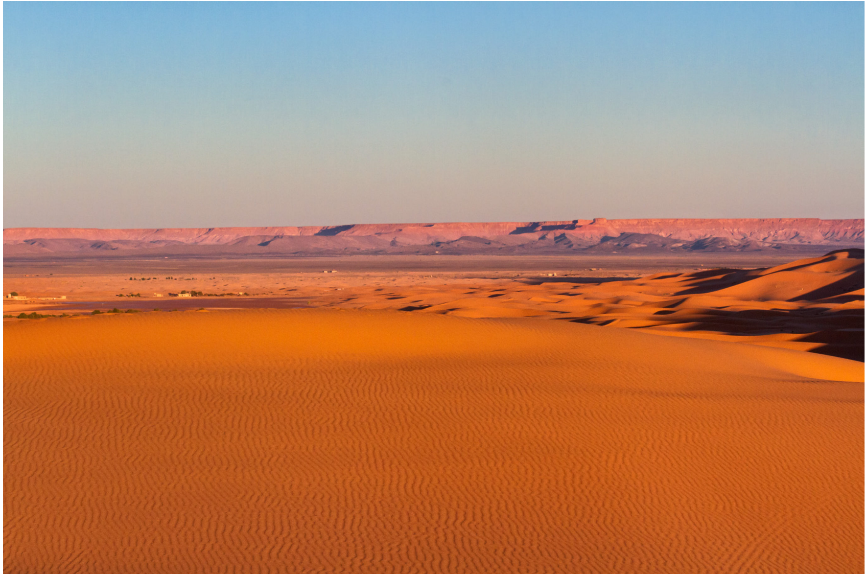
Ausläufer der Sahara, Erg Chebi, Marokko 2012