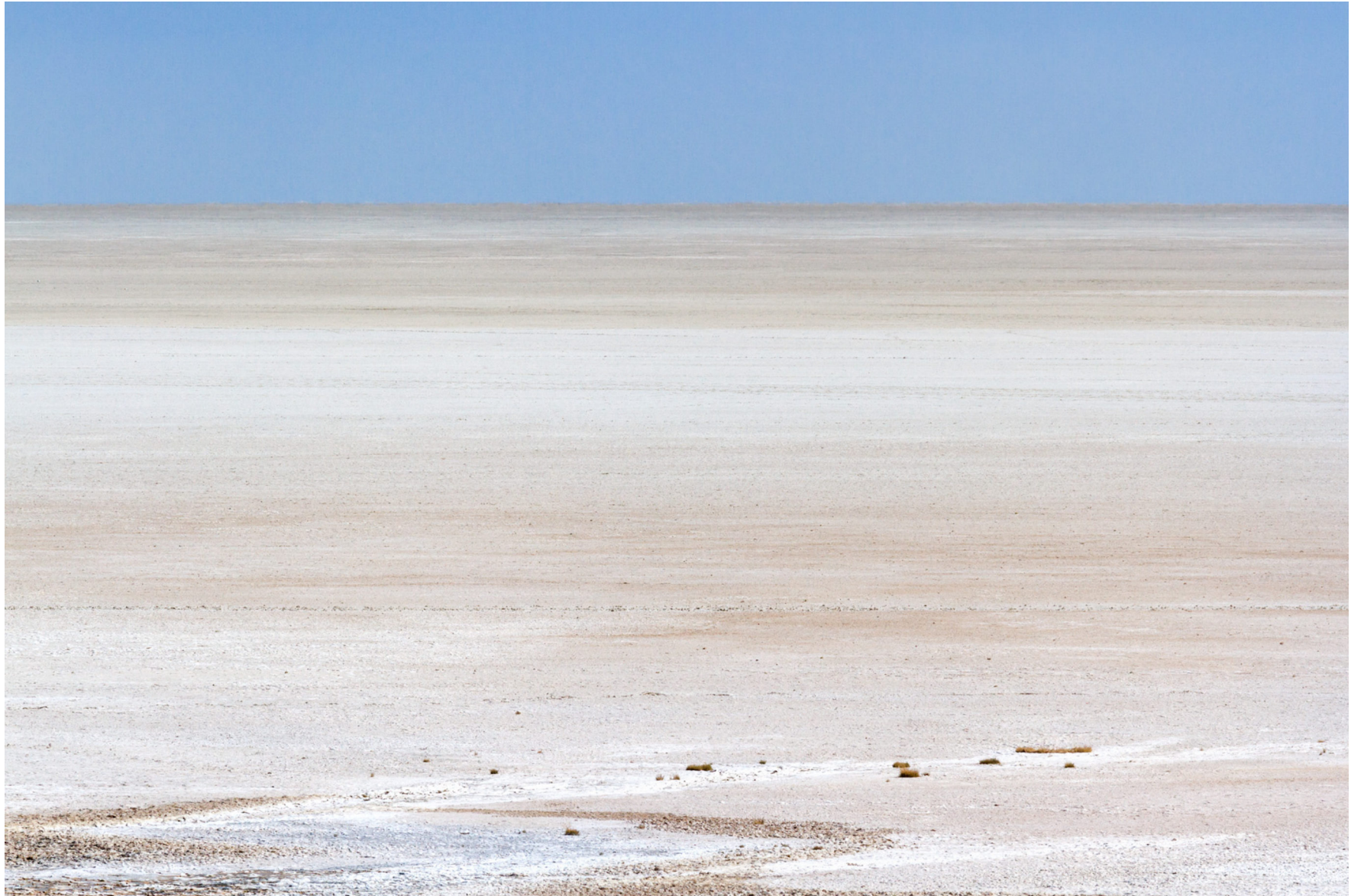
Etosha Salzpfanne , Namibia 2013