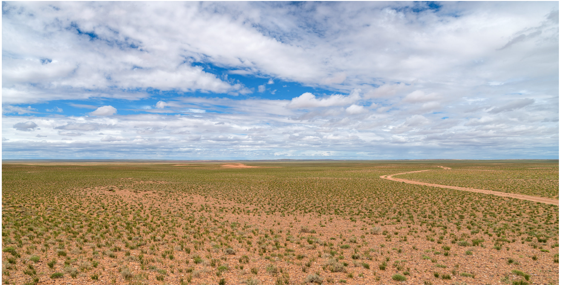
Wüste Gobi, Mongolei 2017