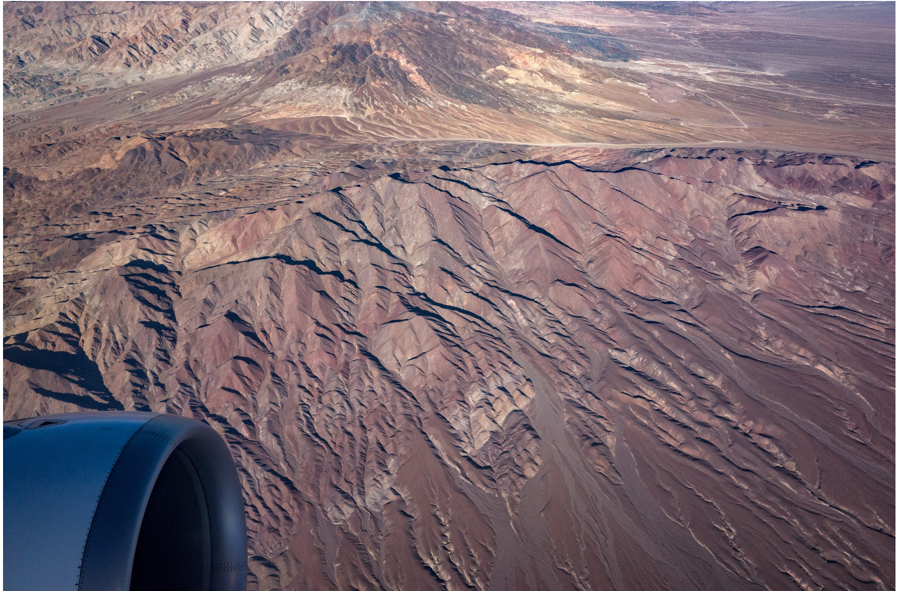
Atacama, Chile, August 2016