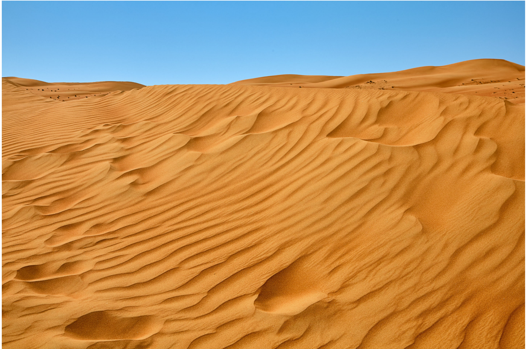
Wahiba Wüste, Oman 2011