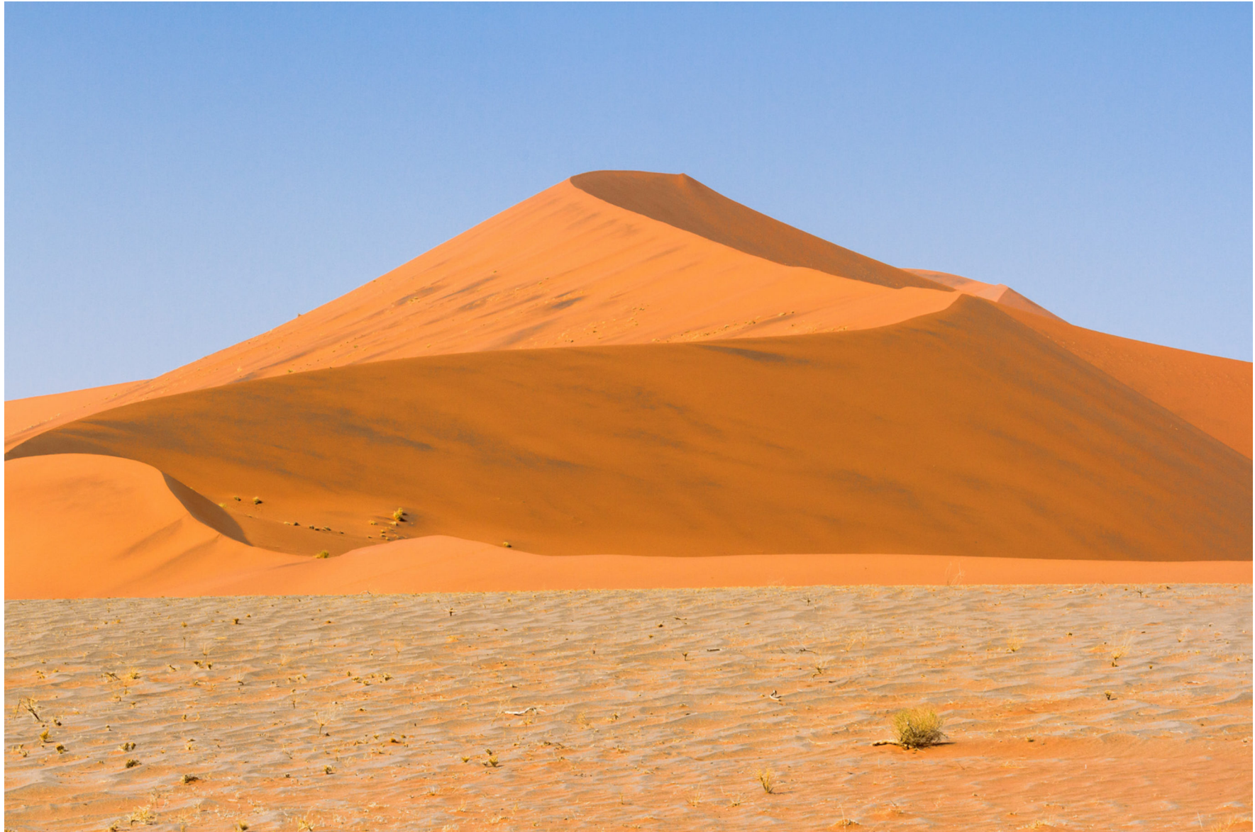
Namib, Namibia 2013