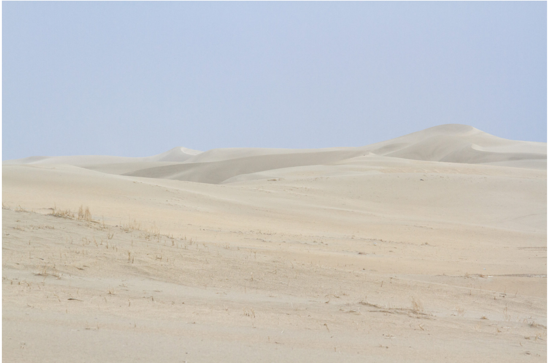
Taklamakan-Wüste, China, Juni 2014