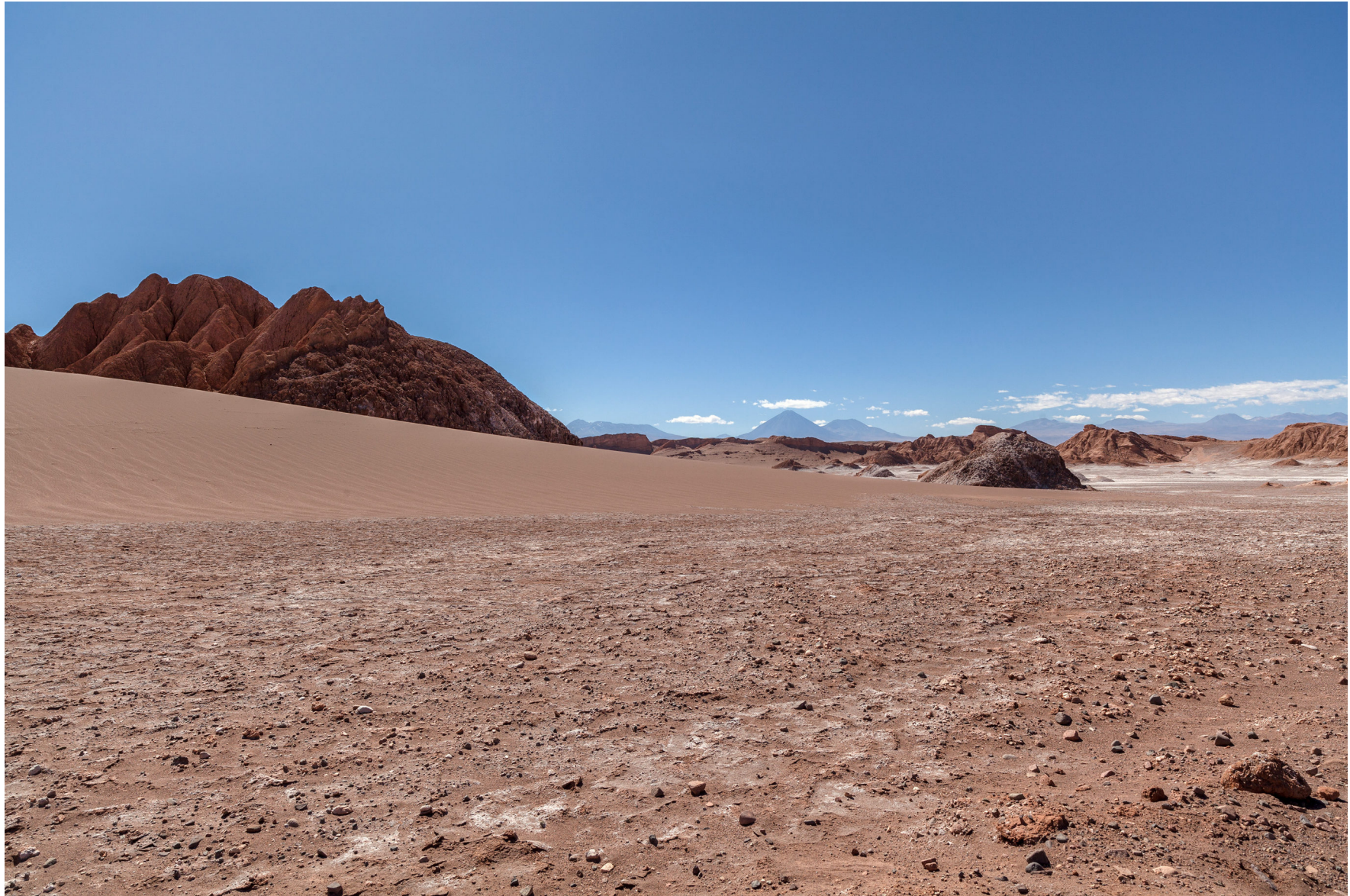
Atacama, Chile, August 2016