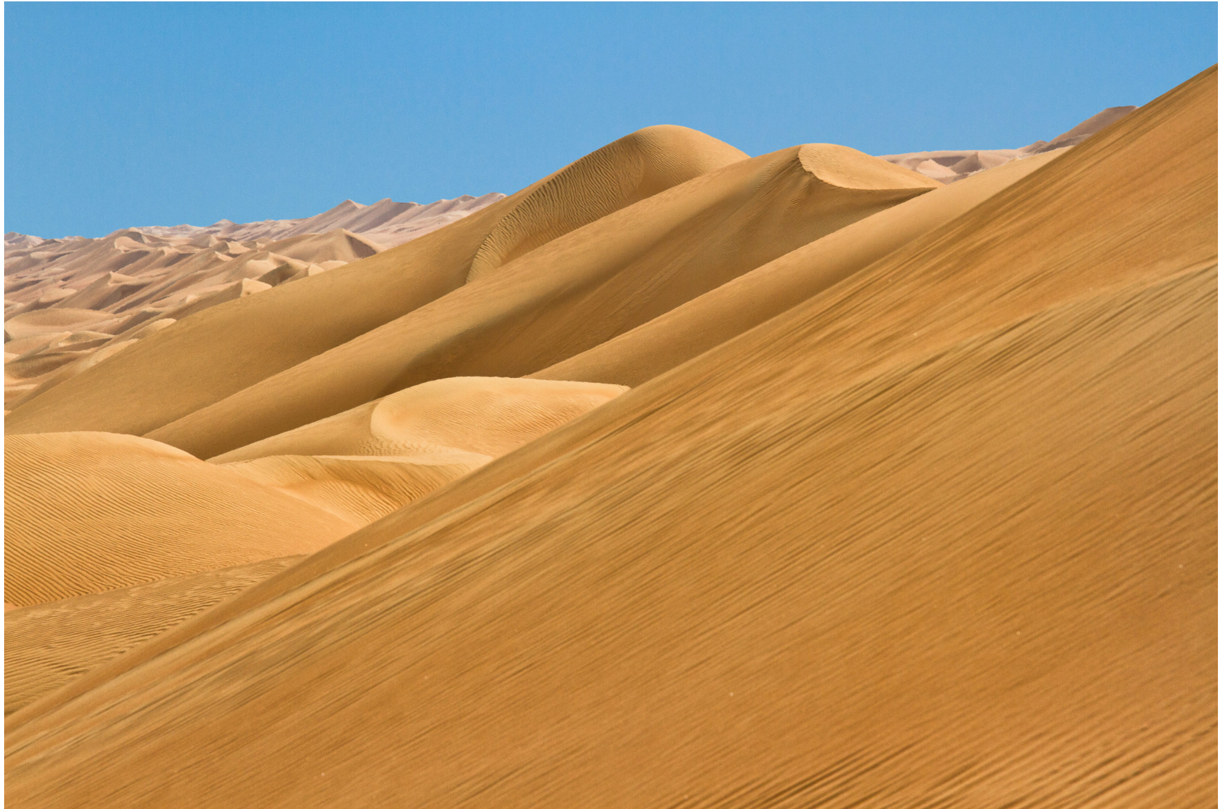
Wahiba Wüste, Oman 2011