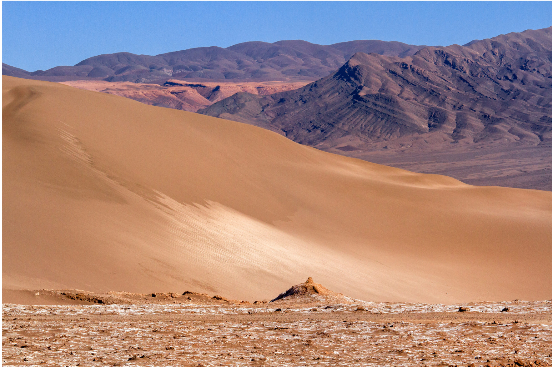
Atacama, Chile, August 2016