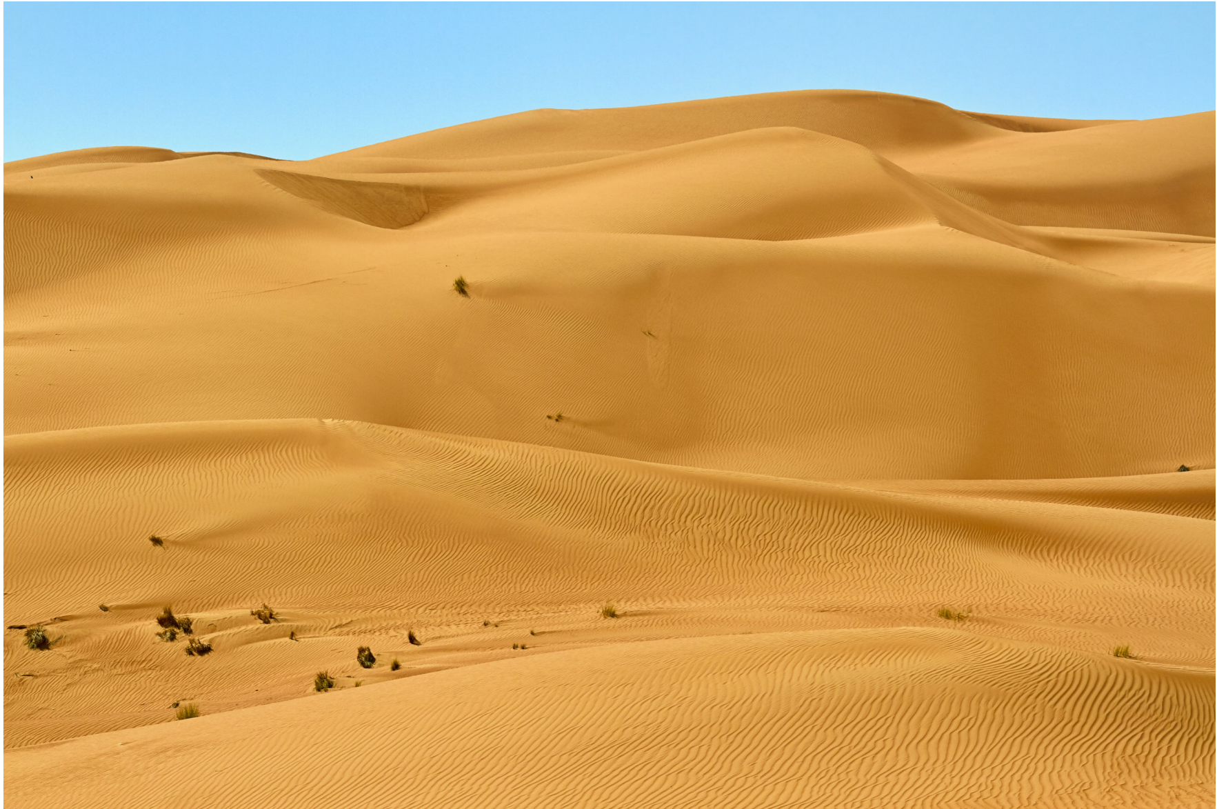
Wahiba Wüste, Oman 2011