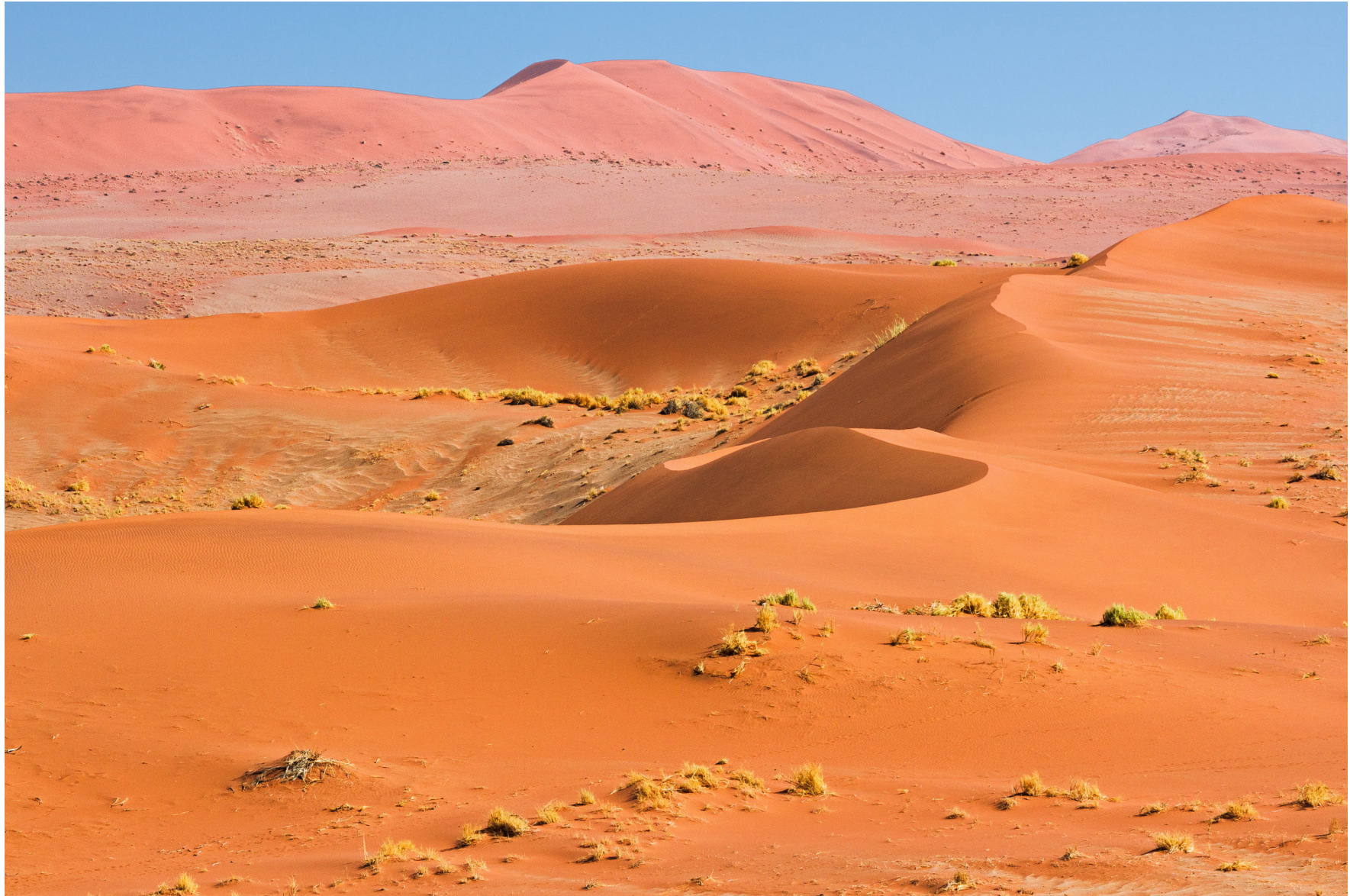
Namib, Namibia 2013