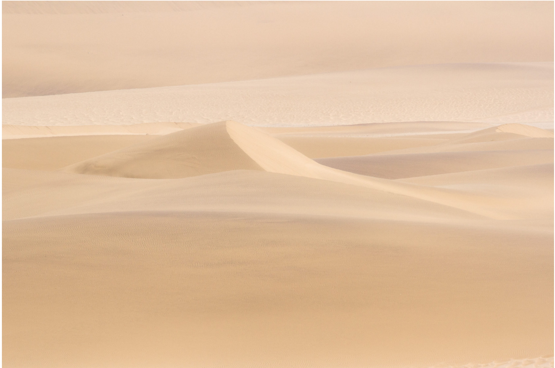
Namib, Namibia 2013