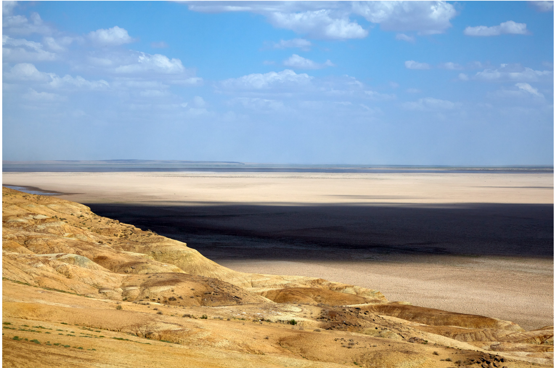
Kysylkum-Wüste, Usbekistan 2011