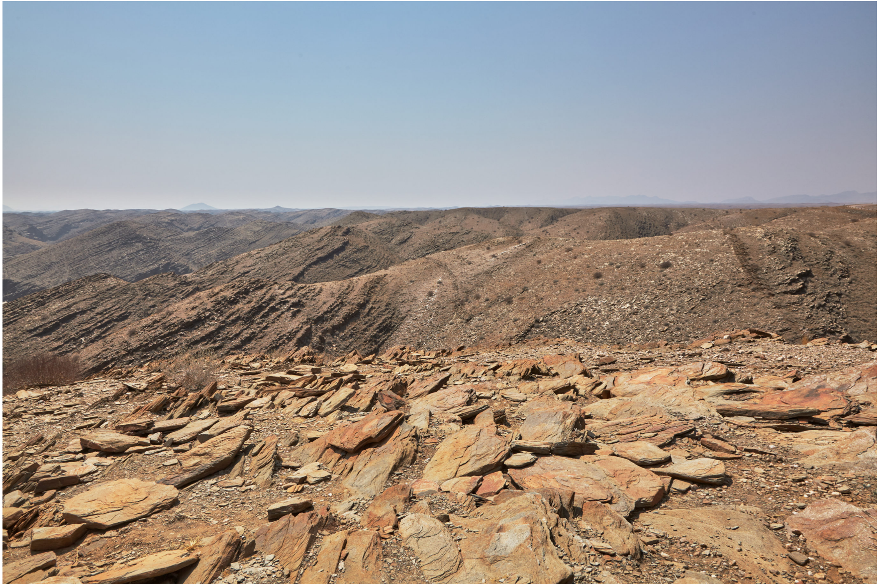
Namib, Namibia 2013