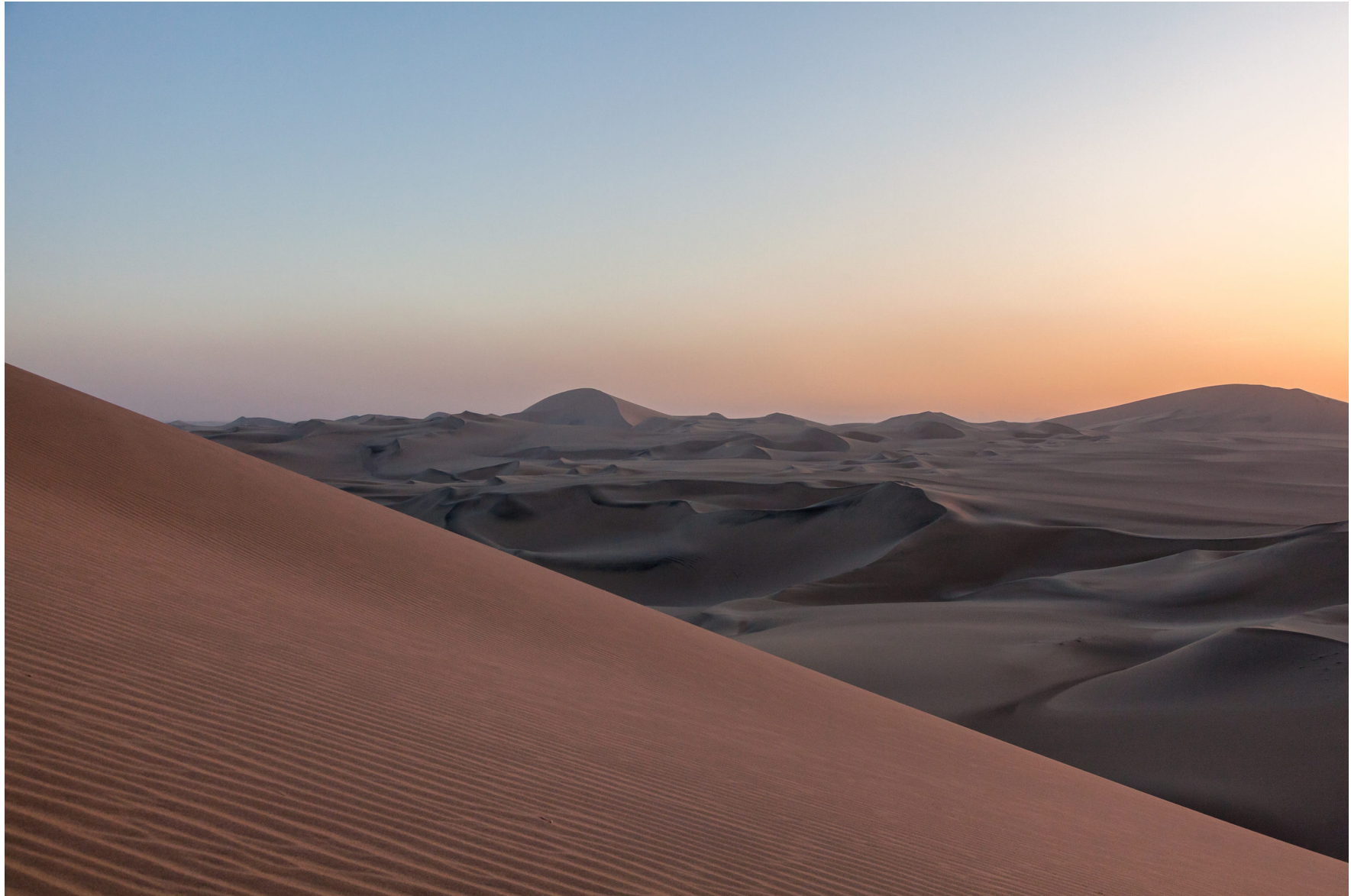
Peruanische Küstenwüste, Peru, August 2016