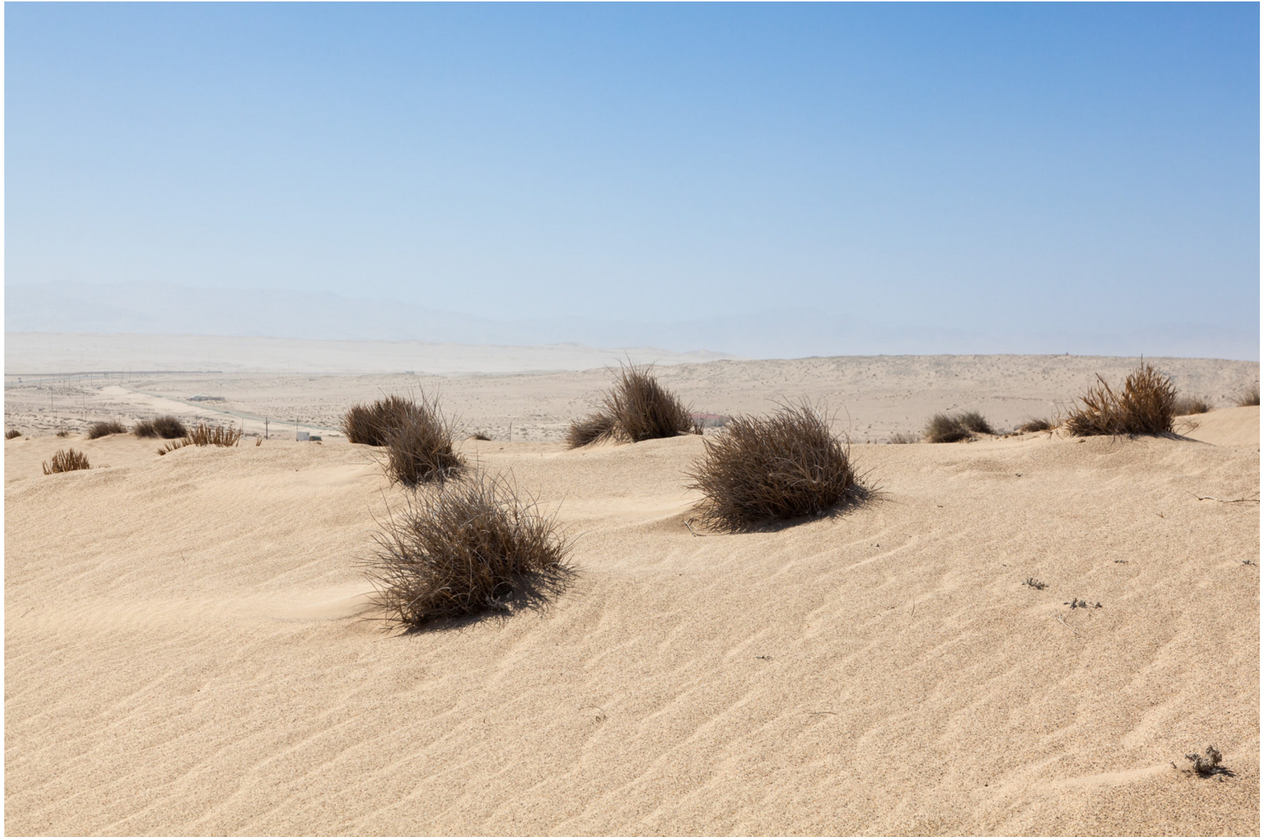
Namib, Namibia 2013