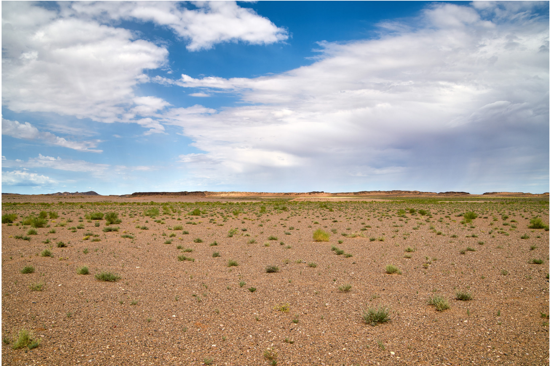
Wüste Gobi, Mongolei 2017