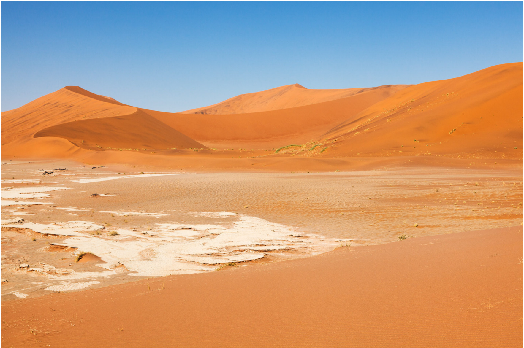
Namib, Namibia 2013