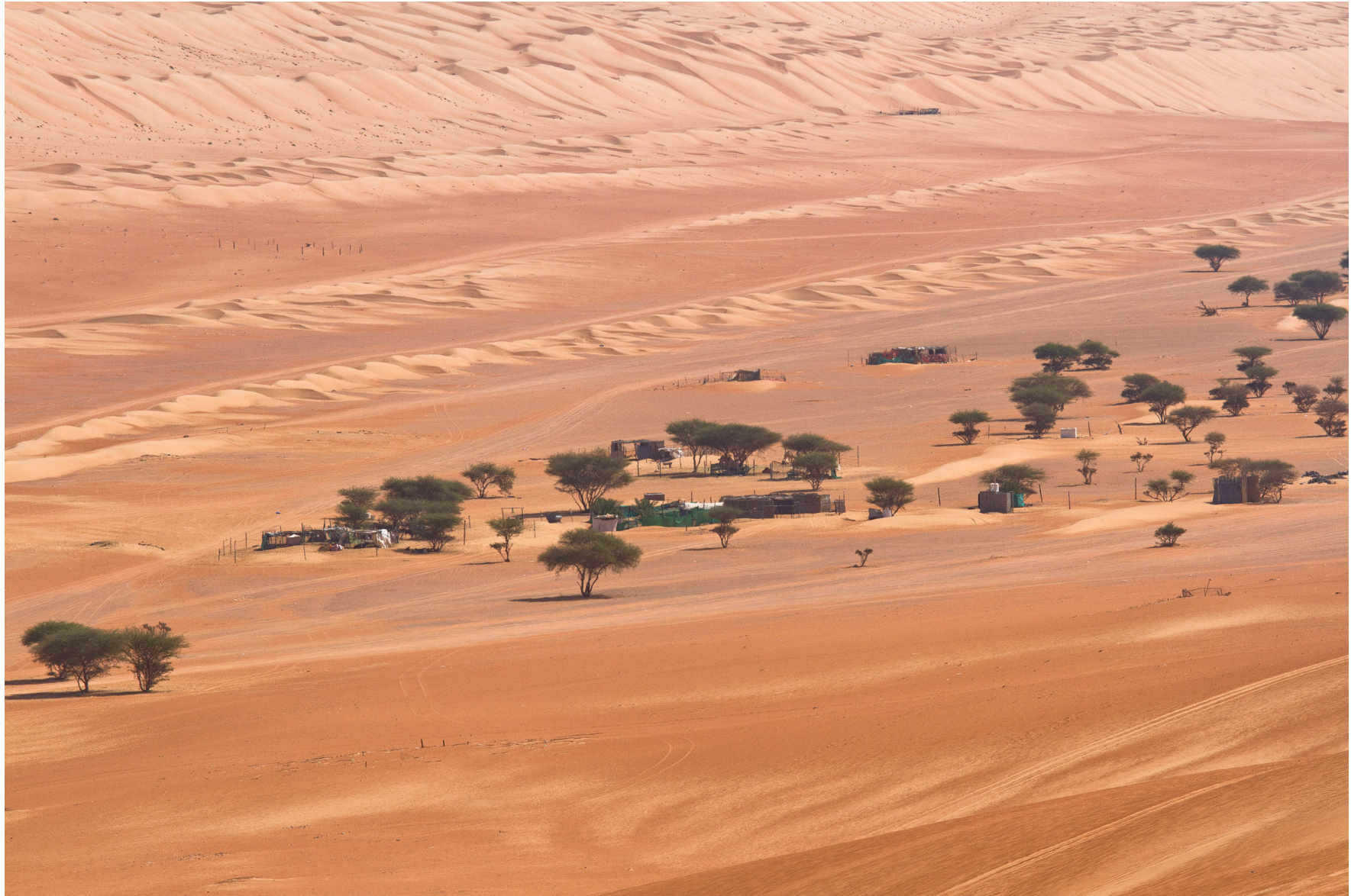
Wahiba Wüste, Oman 2011