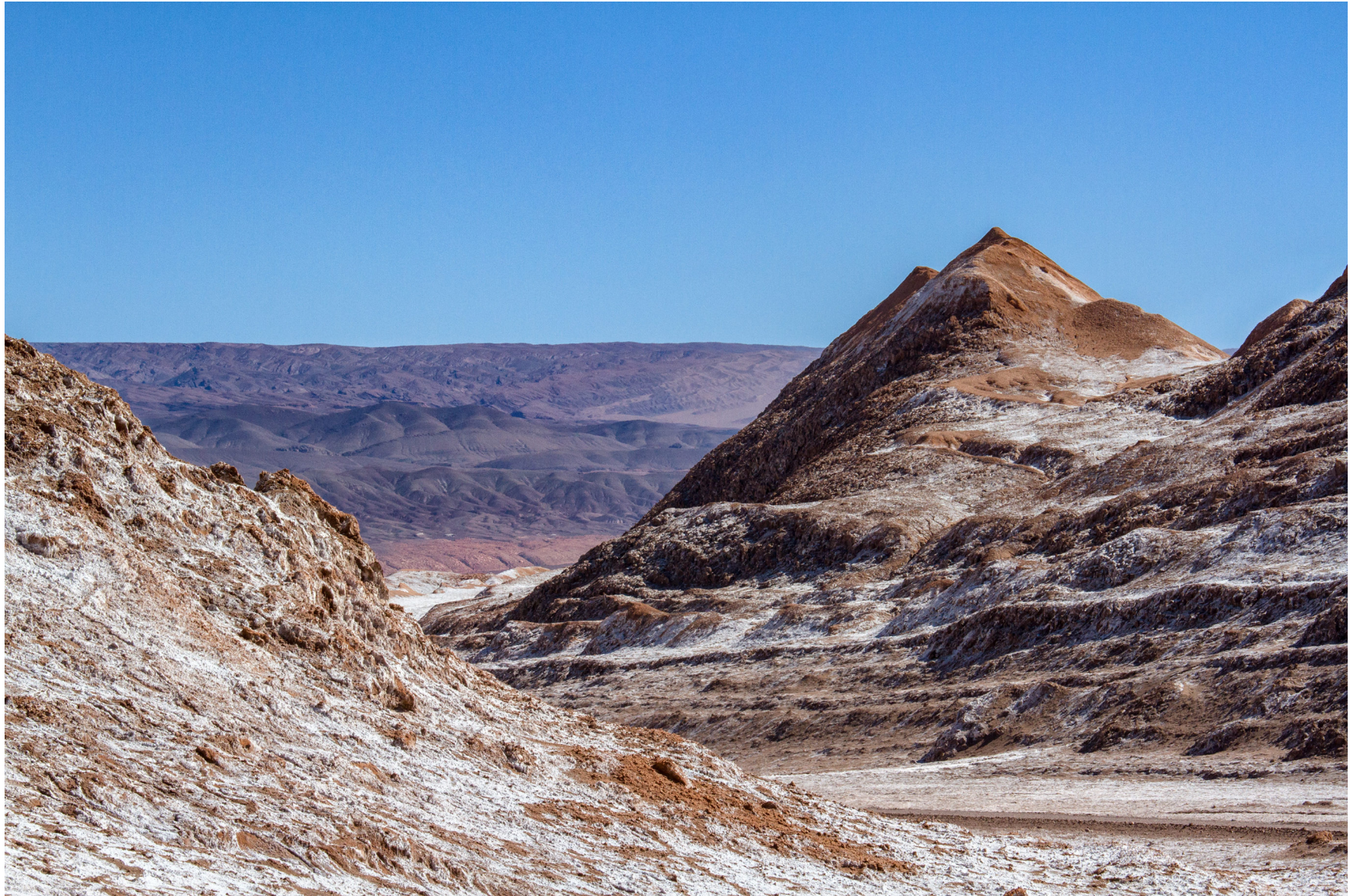
Atacama, Chile, August 2016